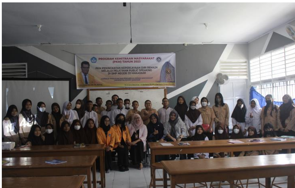
Gambar 11. Foto Bersama dengan Para Peserta Pelatihan dan dengan Para Guru SMP Negeri 33 Makassar