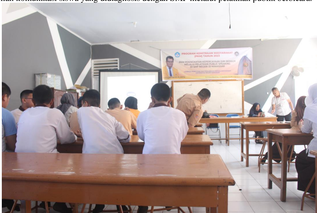
Gambar 2. Foto Saat Pembukaan Pelatihan Oleh Ibu Guru SMP Negeri 33 Makassar

Oleh karena itu, temuan penelitian ini memberikan dukungan empiris terhadap gagasan bahwa mekanisme neuroplastisitas dan pembentukan pola pikir positif secara signifikan memengaruhi perkembangan keterampilan komunikasi siswa yang didiagnosis dengan SMP melalui pelatihan publik berbicara.