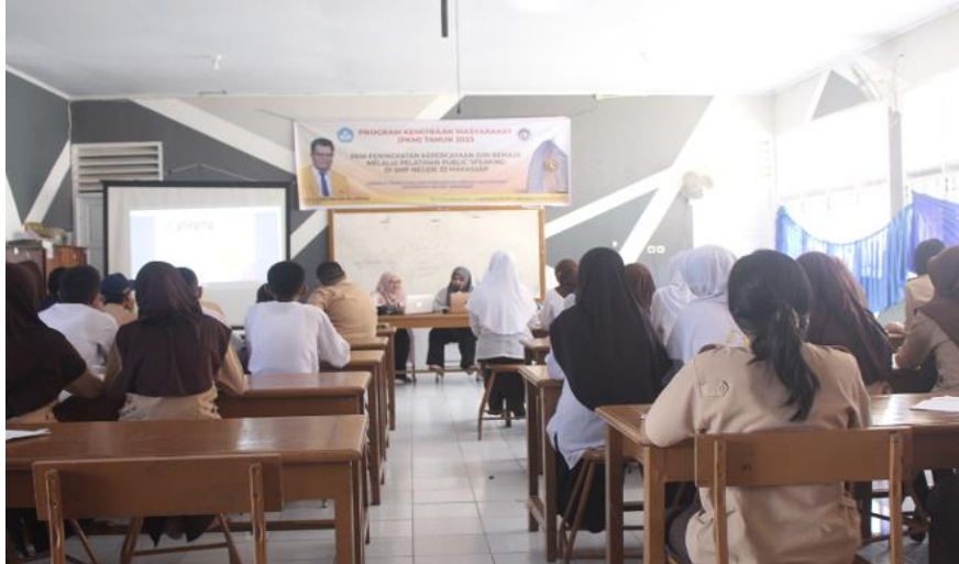
Gambar 6. Dokumentasi Pribadi. Foto Saat Pemateri Pertama Menjelaskan Mengenai Public speaking