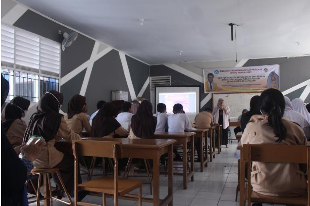
Gambar 8. Foto Para Peserta Pelatihan Public speaking Saat Sedang Memperhatikan Pemateri