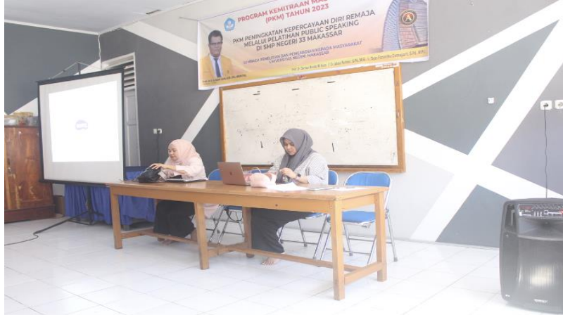
Gambar 3. Para Pemateri Pelatihan Public speaking