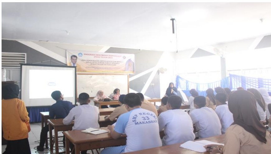
Gambar 4. Dokumentasi Pribadi. Foto Para Peserta Pelatihan Public speaking Sedang memperhatikan sambutan