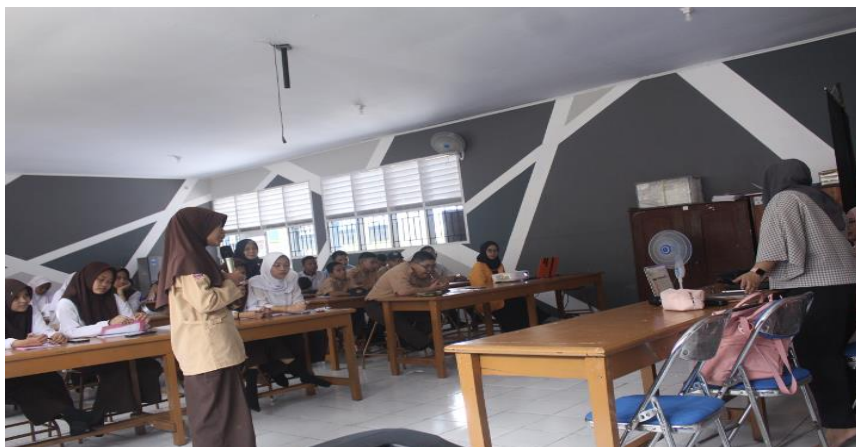
Gambar 10. Salah satu Peserta Pelatihan Sedang Mengajukan Pertanyaan Ke Para Pemateri