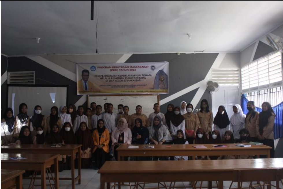
Gambar 11. Dokumentasi Pribadi. Foto Bersama dengan Para Peserta Pelatihan dan dengan Para Guru SMP Negeri 33 Makassar