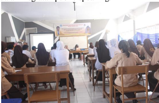
Gambar 1. Foto Kegiatan

Berdasarkan hasil observasi yang telah dilakukan di lapangan dan diskusi dengan guru baik guru mata pelajaran dan guru bimbingan konseling di SMPN 33 Makassar maka dapat dijelaskan beberapa permasalahan yaitu para siswa memiliki kemampuan public speaking yang masih rendah. Dalam setiap kegiatan yang tampil sebagai pembawa acara atau MC hanya itu-itu saja. Padahal pada dasarnya banyak siswa yang memiliki kesempatan yang sama dalam menjadi pembawa acara atau MC hanya saja belum terdapat arahan, pelatihan dan bimbingan untuk bisa mahir dalam kegiatan public speaking .