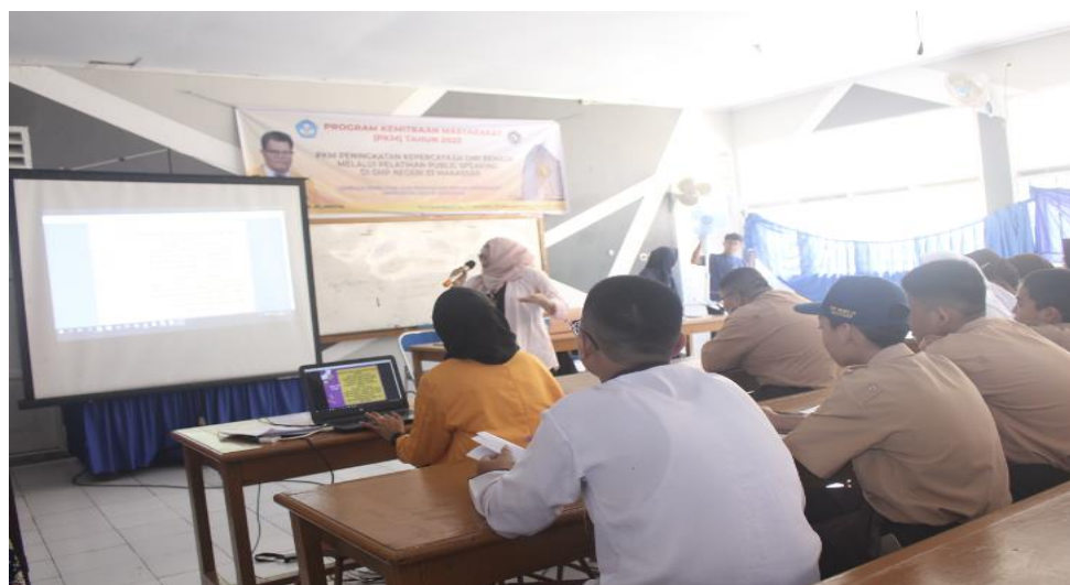
Gambar 8. Dokumentasi Pribadi. Foto Saat Pemateri Kedua Menjelaskan Mengenai Public speaking