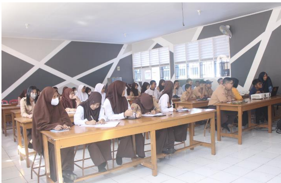
Gambar 5. Foto Para Peserta Pelatihan Public speaking