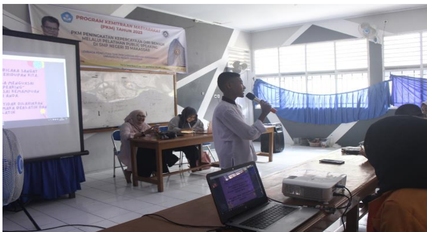
Gambar 9. Salah satu Peserta Pelatihan Sedang Menunjukkan Cara yang Baik Saat Berbicara di depan umum