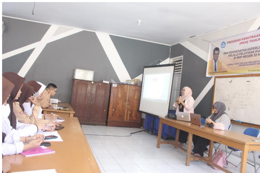
Gambar 7. Dokumentasi Pribadi. Foto Saat Pemateri Kedua Menjelaskan Mengenai Public speaking