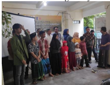
Gambar 2. Pelaksanaan acara bakti amal

Penulis menjelaskan bahwa pendidikan ke jenjang perguruan tinggi memberikan banyak manfaat baik bagi individu maupun masyarakat secara keseluruhan. Ini membantu dalam pengembangan pengetahuan, keterampilan, dan karakter individu, serta berkontribusi pada perkembangan sosial, ekonomi, dan budaya masyarakat. Menurut Undang-Undang Republik Indonesia Nomor 20 Tahun 2003 Tentang Sistem Pendidikan Nasional bahwa Pendidikan adalah usaha sadar dan terencana untuk mewujudkan suasana belajar dan proses pembelajaran agar peserta didik secara aktif mengembangkan potensi dirinya untuk memiliki kekuatan spiritual keagamaan, pengendalian diri, kepribadian, kecerdasan, akhlak mulia, serta keterampilan yang diperlukan dirinya, masyarakat, bangsa dan negara. Pentingnya kualitas pendidikan tinggi bagi kemajuan teknologi suatu negara sangat signifikan. Pendidikan tinggi berperan sebagai kunci dan sangat penting dalam menentukan kemampuan suatu bangsa untuk mencapai kemajuan dan menciptakan kesejahteraan bagi seluruh rakyat. Adaptasi dan inovasi yang didorong oleh pendidikan tinggi membantu negara dalam mencapai kemajuan teknologi. Oleh karena itu, penting untuk menjaga kualitas pendidikan tinggi di Indonesia agar dapat melahirkan individu yang terdidik, terpelajar, memiliki kecerdasan, dan keterampilan yang mampu menghasilkan kemajuan di berbagai bidang dengan profesionalisme dan integritas. Upaya ini harus menjadi perhatian bersama bagi masyarakat.