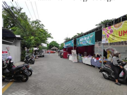
Gambar 1. Kondisi bazar ramadhan yang di Kelurahan Rungkut Tengah

Survei dan observasi lapangan telah dilakukan untuk mengidentifikasi berbagai permasalahan dan potensi yang ada di UMKM Kelurahan Rungkut Tengah. Hasilnya menunjukkan bahwa terdapat beberapa permasalahan yang dihadapi oleh para pelaku usaha, seperti kurangnya inovasi dalam produk dan kemasan, cakupan pemasaran yang terbatas, dan pemanfaatan teknologi sebagai media promosi yang belum optimal.