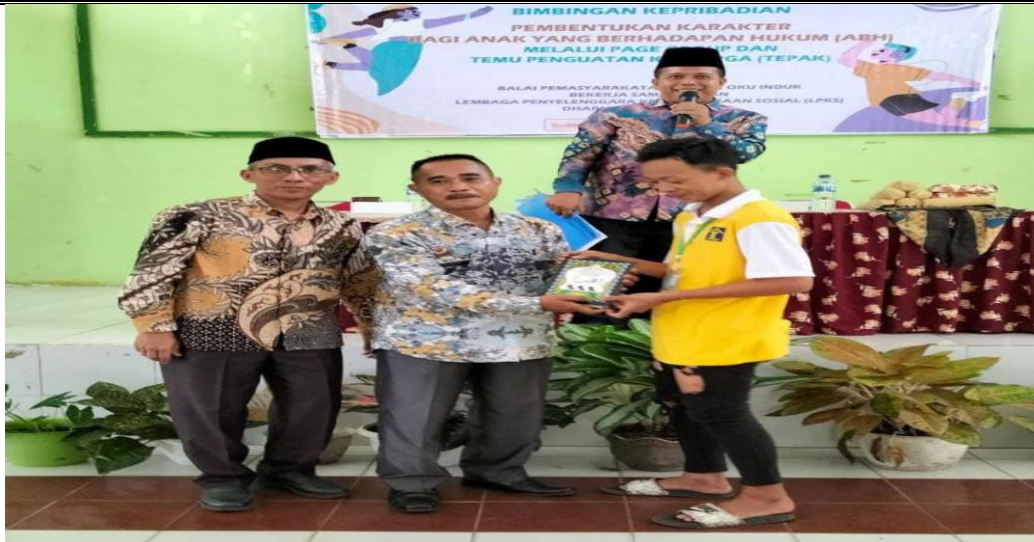
Gambar 4. Tim Pengabdian Masyarakat Memberikan Buku Iqra kepada Anak-Anak

Menurut (Mubarok, 2022) bahwa latar belakang terbentuknya perilaku anak berhadapan dengan hukum (ABH) ialah dari pola asuh orang tua dan pergaulan di lingkungan sosial anak yang cenderung memberikan hal-hal negatif. Begitu pula menurut (Putra, Swardhana, & Purwani, 2018) bahwa faktor yang mempengaruhi perilaku anak yaitu dari faktor orang tua dan keluarga, faktor pergaulan, faktor pendidikan, faktor ekonomi, dan faktor media massa.