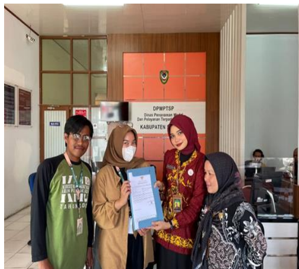
Gambar 4. Pengajuan NTB dan Sertifikasi Halal