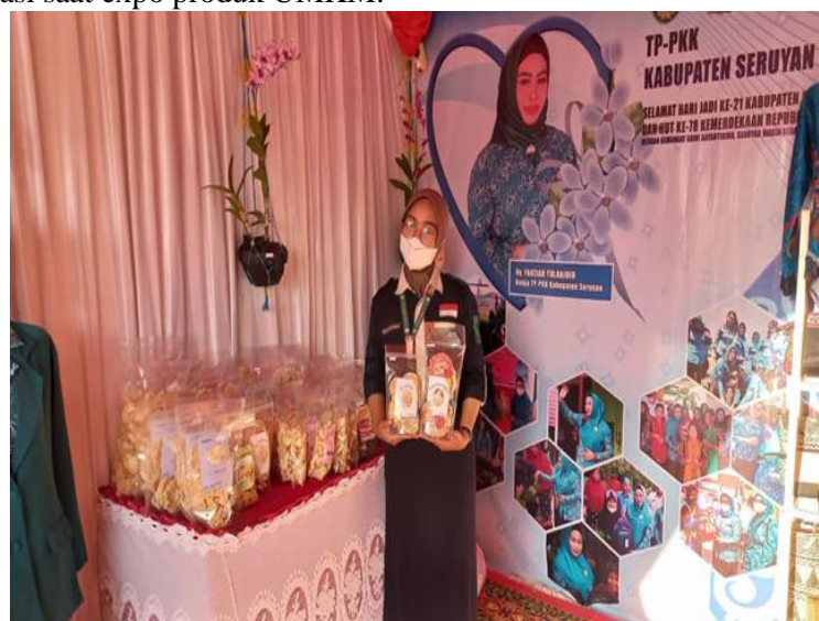
Gambar 5. Expo produk UMKM

Salah satu kendala berkembangnya UMKM bukan hanya terletak pada kualitas produk, tetapi juga bagaimana cara sebuah UMKM mampu melaksanakan marketing (pemasaran) yang baik (Arina et al., 2022). Kegiatan pendampingan pada proses marketing (pemasaran) UMKM dilakukan dengan memberikan pemahaman mengenai pentingnya kemampuan melakukan pemasaran pada produk yang telah dibuat agar mendapatkan konsumen seluas-luasnya. Masyarakat diberikan pengetahuan bagaimana strategi pemasaran atau marketing yang lebih efektif dan efisien untuk mendukung proses penjualan produk yang dibuat (Bakhri & Futiah, 2020). Penggunaan media sosial merupakan salah satu strategi yang ditawarkan sebagai strategi marketing (pemasaran) yang dapat digunakan oleh masyarakat untuk mendukung proses pemasaran produk hasil UMKM masyarakat di UPT Tanggul Harapan. Selain itu, pemanfaatan kegiatan yang ada diadakan oleh pemerintah juga dapat digunakan sebagai sarana promosi produk UMKM UPT Tanggul Harapan, seperti kegiatan Expo yang diadakan oleh pemerintah Kabupaten Seruyan dalam rangka memperingati Hari Ulang Tahun Kabupaten Seruyan. Berikut gambar 5 adalah salah satu dokumentasi saat expo produk UMKM.