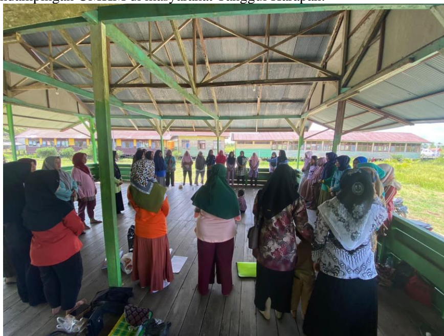
Gambar 1. Kegiatan pendampingan pengurusan Surat Izin Berusaha (NIB) dan sertifikasi halal pada UMKM di UPT Tanggul Harapan

pendaftaran Surat Izin Berusaha (NIB) dan sertifikasi halal menjadi salah satu alasan yang mendukung untuk diadakan kegiatan pendampingan UMKM di masyarakat Tanggul Harapan.