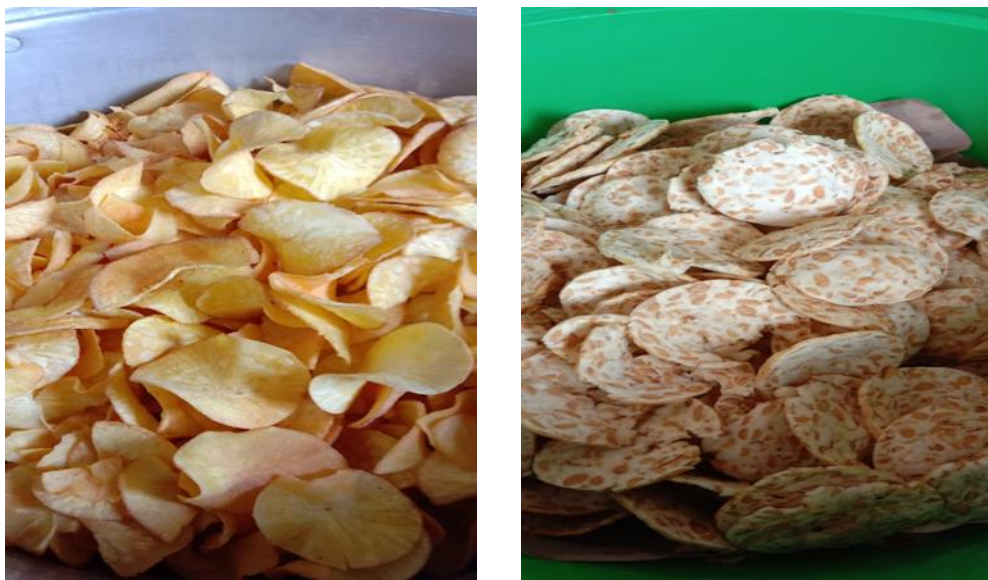
Gambar 2. Sampel Produk UMKM

Secara sederhana, pengertian dari producing (produksi) adalah kegiatan menghasilkan barang atau jasa. Menurut Layaman dan Nurlatifah, Produksi ialah kegiatan yang dilakukan oleh manusia untuk menghasilkan barang dan jasa yang selanjutnya dapat dimanfaatkan oleh konsumen (Layaman & Nurlatifah, 2016). Producing (produksi) dilakukan ketika kebutuhan manusia terhadap barang atau jasa sedikit dan sederhana. Secara teknis, produksi adalah proses mentransformasi input menjadi output. Artinya dalam kegiatan produksi terjadi proses perubahan input (masukan) menjadi output (hasil).