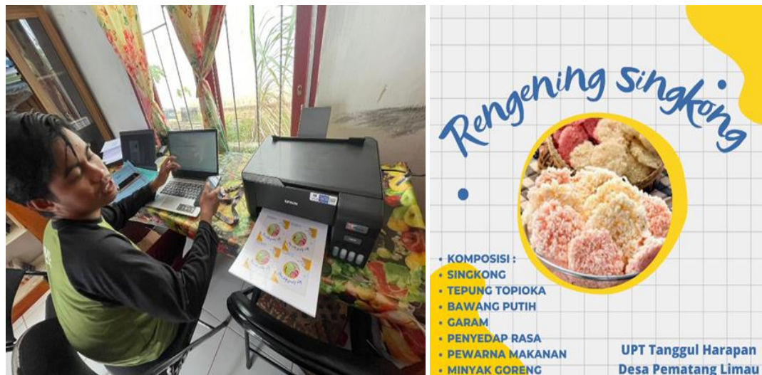
Gambar 3. Pembuatan label UMKM

Aturan dalam bidang perizinan sudah diterapkan oleh Kementerian Koordinator Bidang Perekonomian RI sejak bulan Mei 2018. Aturan tersebut menganjurkan agar para pemilik usaha segera melakukan pengurusan NIB, sebagai identitas suatu perusahaan. Dengan adanya NIB, pengusaha dapat menikmati kemudahan dalam mengurus legalitas perusahaan. Jika pelaku usaha sudah memiliki NIB, maka tidak perlu lagi mengurus izin perusahaan seperti API dan TDP. Nomor Induk Berusaha merupakan identitas pelaku usaha baik usaha perorangan, badan usaha, maupun badan hukum yang diterbitkan oleh Lembaga OSS setelah pelaku usaha melakukan pendaftaran. Nomor Induk Berusaha (NIB) juga berlaku sebagai Tanda Daftar Perusahaan (TDP), Angka Pengenal Impor (API), dan Akses Kepabeanaan. Berikut salah satu dokumentasi pembuatan label produk dan pendampingan pembuatan Nomor Induk Berusaha (NIB) dan sertifikasi halal.