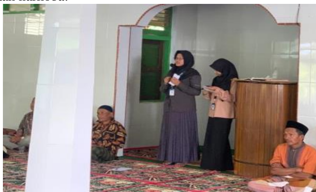
Gambar 1. Penyampaian Materi mengenai Narkoba dan Dampaknya kepada Masyarakat Jorong

Berdasarkan hasil observasi pada tahap survei awal terdapat satu hal yang perlu dikembangkan yaitu mengubah pola pikir masyarakat Jorong Taratak Dama terkait tentang apa itu pengertian narkoba, bahaya dari narkoba, dampak dari narkoba itu sendiri dan efek dari penggunaan narkoba. Sehingga tercapai tujuan untuk menciptakan atau membranding lokasi Jorong Taratak Dama menjadi tempat yang dikenal sebagai "Jorong Taratak Dama Tangguh Bebas Narkoba Kecamatan Hiliran Gumanti Kabupaten Solok". Berdasarkan uraian di atas, KKN yang merupakan program Pengabdian Pada Masyarakat oleh Universitas Negeri Padang yang bersifat Reguler (KKN Reguler) sangat relevan diadakan di kampung tersebut. KKN Reguler UNP tahun 2023 di Jorong Taratak Dama Nagari Talang Babungo Kecamatan Hiliran Gumanti Kabupaten Solok ini diharapkan mampu menjadi sarana penggerak partisipasi aktif masyarakat dalam memanfaatkan Sumber Daya Alam (SDA) maupun Sumber Daya Manusia (SDM) sebagai Jorong Tangguh Bebas Narkoba dengan cara memberi pengetahuan berupa pemberian edukasi melalui program sosialisasi secara bersama kepada masyarakat Jorong Taratak Dama Kecamatan Hiliran Gumanti Kabupaten Solok Nagari Talang Babungo tentang bahaya akan penyalahgunaan penggunaan narkoba.