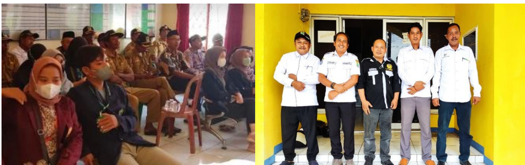
Gambar 5. Kegiatan Penguatan Keterampilan Manajemen Konflik berbasis Pendidikan