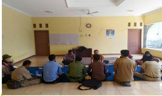
Gambar 2. FGD ( Focus Group Discussion ) dengan Aparat Desa Sindangkarya