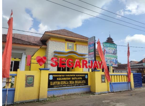
Gambar 4. Kantor Desa