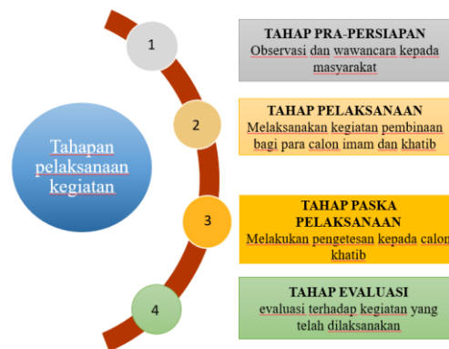
Gambar 2. Tahapan kegiatan

Keseluruhan tahapan ini dapat dilihat pada Gambar 1 berikut ini.