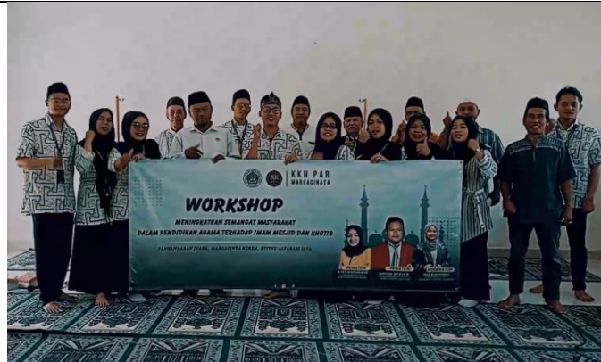
Gambar 1. Lokasi kegiatan pengabdian kepada masyarakat