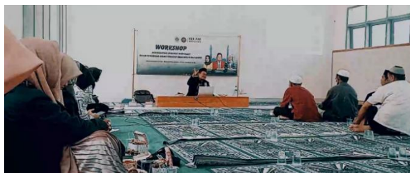
Gambar 3. Kegiatan workshop