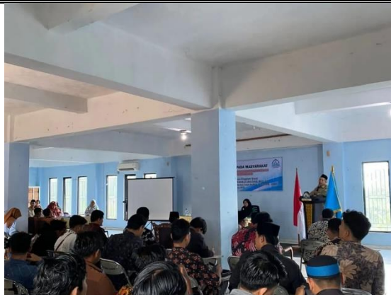
Gambar 2. Guru-guru yang hadir sebagai peserta pelatihan

Selain meningkatkan keterampilan pengajaran, pelatihan ini juga menghasilkan sumber daya pendukung seperti materi ajar yang relevan dan alat bantu pembelajaran yang kreatif. Hal ini akan menjadi aset berharga bagi guru-guru dalam mengembangkan pengajaran mereka di masa depan. Hasil positif ini mencerminkan kesuksesan pelatihan dalam mencapai tujuan utama, yaitu meningkatkan kualitas pendidikan agama Islam di madrasah ibtidaiyah.