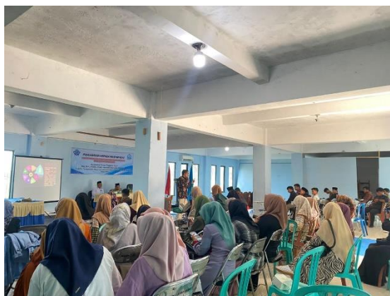
Gambar 3. Kegiatan pelatihan dan penyampaian materi kepada guru-guru yang hadir

Hasil dan pembahasan ini juga memberikan dasar bagi pengembangan lebih lanjut dalam bidang ini dan dapat dijadikan referensi untuk pelatihan serupa di lokasi lain. Dengan terus mendukung dan mengembangkan metode pembelajaran berbasis Integrated Joyful Religious Learning , pendidikan agama Islam di madrasah ibtidaiyah dapat terus berinovasi dan menjadi lebih relevan dalam menghadapi perubahan zaman.