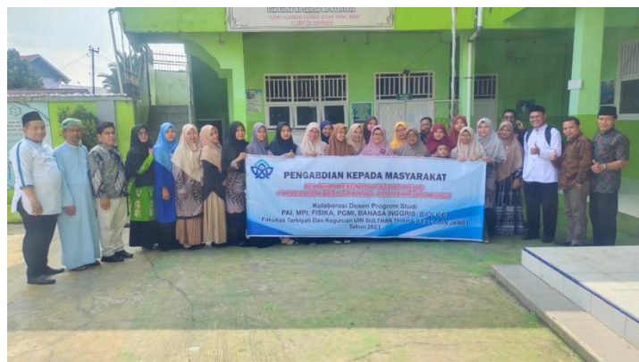
Gambar 1. Lokasi PkM di Madrasah Ibtidaiyah Baitul Hasanah Kabupaten Muara Bungo

Guru-guru di Madrasah Ibtidaiyah Baitul Hasanah terbiasa mengajar dengan metode konvensional yang dirasa kurang menyenangkan dan minim kolaborasi aktif antara guru dan siswa. Pembelajaran Pendidikan agama Islam khususnya masih terpaku pada kegiatan di kelas saja dan belum menggali kreativitas siswa dalam pembelajaran. Oleh karena itu, tim pelaksana PkM memilih metode pembelajaran menyenangkan berbasis Joyful Integrated Learning dimana pembelajaran dapat dilaksanakan dengan memberikan kegiatan yang menyenangkan seperti penggunaan teknologi dan aktivitas kreatif yang berhubungan dengan seni dan proyek untuk menggali pemikiran kritis siswa dalam pembelajaran.