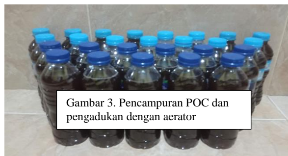
Gambar 5. Pengemasan POC, siap diaplikasikan sesuai dosis

Pengaplikasian POC bisa menggunakan gembor. Pupuk ini dapat diberikan pada akar dan daun tumbuhan. Cara aplikasi pada akar yaitu dengan mencampurkan 1 bagian POC dengan 3 bagian