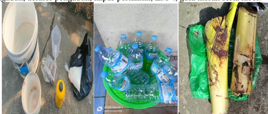
Limbah batang pisang, Botol kemasan 1,5 L, Bahan dan Alat pembuat POC Gambar 3. Persiapan Alat dan Bahan untuk Pembuatan POC

Sebelum Praktek pembuatan POC dilakukan, maka dipersiapkan terlebih dahulu alat dan bahan yang diperlukan, antara lain limbah bahan organik (batang pisang), air hujan minimal 3 L, botol kemasan bhn uk 1,5 L, ember pengaduk, aerator pengaduk, kapur pertanian, EM 4, gula merah serta label.