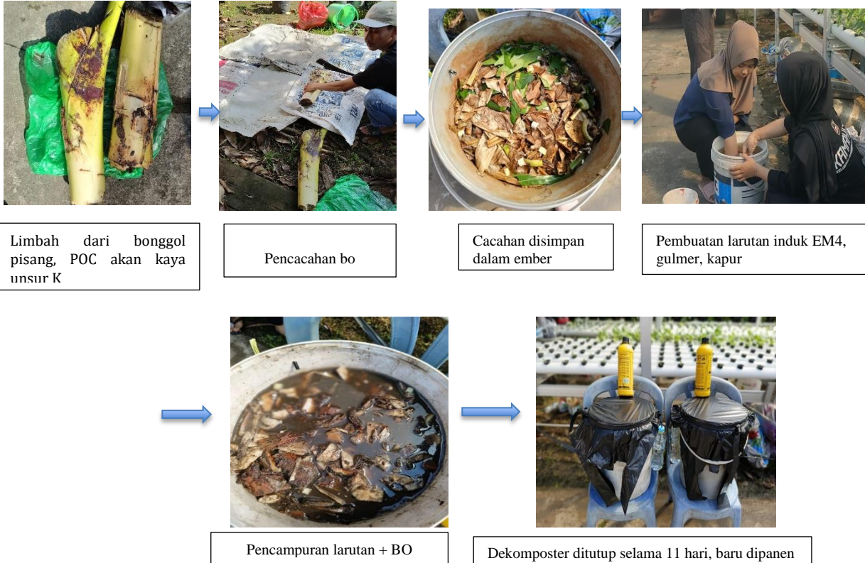
Gambar 4. Tahapan Cara Membuat POC