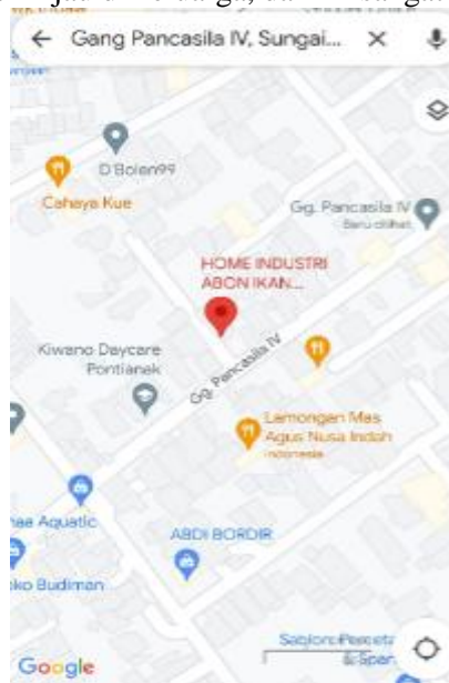
Gambar 2. Lokasi PKM