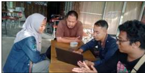
Gambar 1. Kegiatan PkM

Pelaksanaan pengabdian ini dilakukan dalam rentan waktu 30 Agustus 2023 hingga 4 November 2023 di Desa Pandanrejo, dalam pelaksanaan kegiatan ini terdapat pembuatan laporan keuangan dengan menggunakan excel macro berbasis VBA yang menjadi sistem pencatatan baru di Perusahaan Air Minum Desa (PAMDes) Pandanrejo.