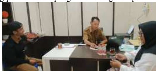
Gambar 2. Kegiatan PkM

Seluruh alur dan proses yang telah dilakukan atas supervisi langsung dari pihak Pemerintah Desa. Pemerintah Desa memonitoring kegiatan PAMDes untuk mengantisipasi penyalahgunaan pengelolaan. Saat diskusi dengan Pemerintah Desa, narasumber menjelaskan perlunya supervisi oleh Pemdes untuk mengantisipasi masyarakat yang protes karena pengelola kurang transparan.