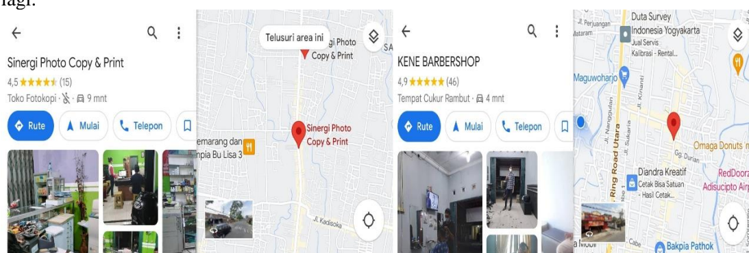
Gambar 1. Tempat Pelaksanaan Pengabdian

penggunaan aplikasi buku warung ini bisamengajarkan untuk bisa mengelola keuangan mereka secara lebih efisien lagi.