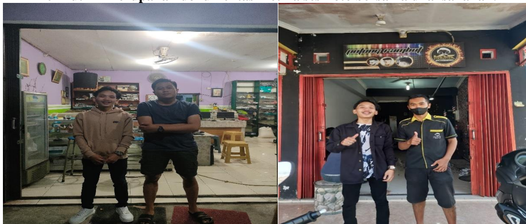
Gambar 4. dokumentasi di hari terakhir pelatihan

Berikut ini merupakan dokumentasi ketika sesi foto bersama dilaksanakan: