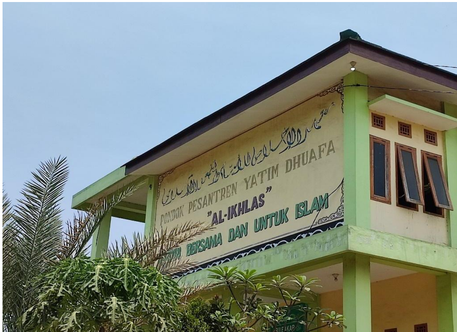
Gambar 1. PPYD Al-Ikhlash Singosari

besarnya tagihan listrik PLN di PPYD Al-Ikhlash. Adapun foto lokasi pengabdian ditunjukkan oleh Gambar 1.