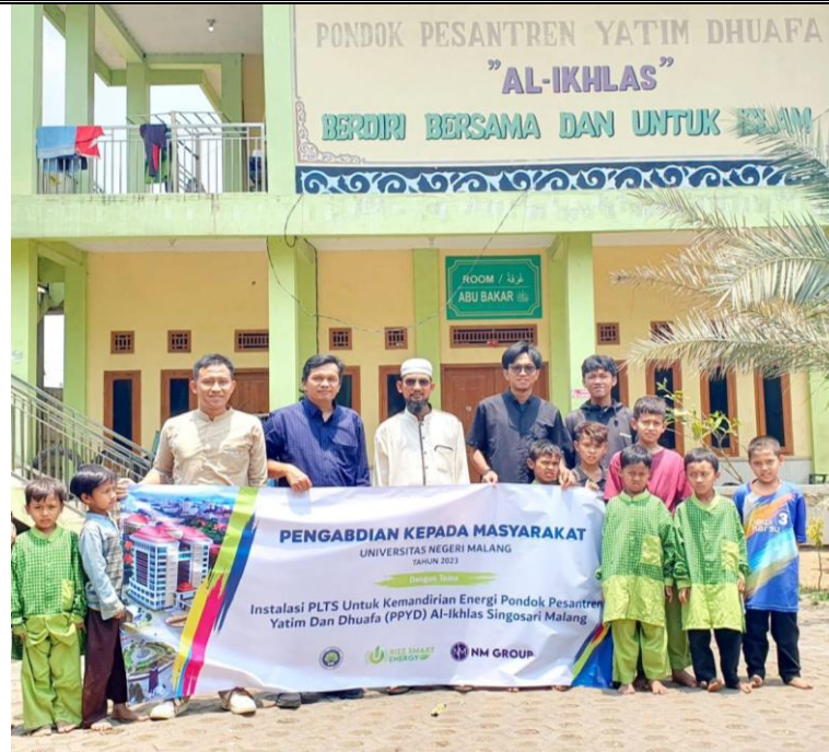
Gambar 5. Foto Bersama Tim Pengabdian UM dan PPYD Al-Ikhlash