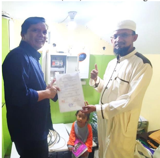
Gambar 4. Serah Terima Pengabdian Instalasi PLTS di PPYD Al-Ikhlas

Tim pengabdian Universitas Negeri Malang melakukan pengabdian masyarakat dengan pendekatan yang terstruktur dan terjadwal. Tujuan dari pengabdian masyarakat ini adalah memanfaatkan energi surya untuk memenuhi kebutuhan listrik di pondok mandiri energi. Energi PLTS dapat digunakan untuk kegiatan sehari-hari di PPYD Al-Ikhlas, termasuk kegiatan pembelajaran dan aktivitas lainnya selama 24 jam. Kegiatan pengabdian masyarakat diharap dapat membantu PPYD Al-Ikhlas jika terjadi pemadaman maka listrik tidak ikut padam karena sistem ini diintegrasikan secara hibrid dengan PLN. Hal ini dapat mengurangi biaya yang diperlukan untuk konsumsi listrik dari PLN. Setelah pemasangan, tim melakukan serah terima simbolis kepada mitra setelah memastikan bahwa sistem PLTS siap digunakan yang ditunjukkan pada Gambar 4. Tim pengabdian masyarakat juga memberikan arahan pemeliharaan sistem PLTS kepada pengelola PPYD Al-Ikhlas yang bertanggung jawab atas penggunaan sistem PLTS smart dalam jangka panjang. Selain menyediakan sumber energi listrik, sistem PLTS juga berfungsi sebagai alat pembelajaran bagi para santri tentang energy baru terbarukan (EBT). Dokumentasi kegiatan ditunjukkan oleh Gambar 5.