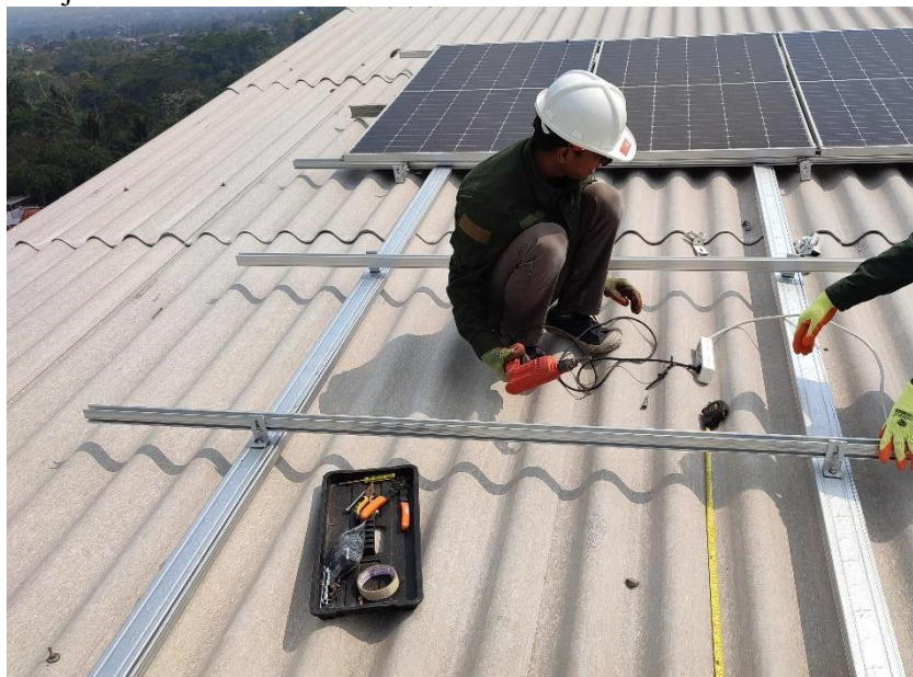
Gambar 2. Proses instalasi PLTS di PPYD Al-Ikhlas

Pengabdian masyarakat ini dimulai dengan observasi pada 6 Juni 2023, setelah observasi dan mendapatkan persetujuan mitra, tim perencana mulai merancang model sistem PLTS yang akan diimplementasikan di PPYD Al-Ikhlas. Kapasitas daya maksimum panel yang akan ditambahkan ke dalam sistem adalah 900 Wp. Secara fisik, sistem ini terdiri dari rangka penyangga panel surya yang terbuat dari baja galvanis tipe kanal C, serta panel box kontrol yang terbuat dari besi dengan ukuran 70 \times 50 \text{ cm}^2 . Kabel jenis solar cable dengan ukuran 6 \text{ mm}^2 digunakan sebagai penghubung antara panel surya dengan panel box kontrol. Sedangkan kabel AC dalam panel box kontrol menggunakan kabel serabut jenis NYAF dengan ukuran 1,5 \text{ mm}^2 . Sistem dalam panel box kontrol dilengkapi rangkaian interlock untuk menjaga keamanan saat beralih dari sumber daya PLN ke PLTS, dan sebaliknya. Kegiatan instalasi ditunjukkan oleh Gambar 2 dan hasil instalasi ditunjukkan oleh Gambar 3.