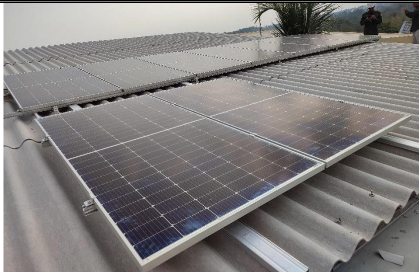
Gambar 3. Hasil instalasi PLTS di PPYD Al-Ikhlas

Tim pengabdian Universitas Negeri Malang melakukan pengabdian masyarakat dengan pendekatan yang terstruktur dan terjadwal. Tujuan dari pengabdian masyarakat ini adalah memanfaatkan energi surya untuk memenuhi kebutuhan listrik di pondok mandiri energi. Energi PLTS dapat digunakan untuk kegiatan sehari-hari di PPYD Al-Ikhlas, termasuk kegiatan pembelajaran dan aktivitas lainnya selama 24 jam. Kegiatan pengabdian masyarakat diharap dapat membantu PPYD Al-Ikhlas jika terjadi pemadaman maka listrik tidak ikut padam karena sistem ini diintegrasikan secara hibrid dengan PLN. Hal ini dapat mengurangi biaya yang diperlukan untuk konsumsi listrik dari PLN. Setelah pemasangan, tim melakukan serah terima simbolis kepada mitra setelah memastikan bahwa sistem PLTS siap digunakan yang ditunjukkan pada Gambar 4. Tim pengabdian masyarakat juga memberikan arahan pemeliharaan sistem PLTS kepada pengelola PPYD Al-Ikhlas yang bertanggung jawab atas penggunaan sistem PLTS smart dalam jangka panjang. Selain menyediakan sumber energi listrik, sistem PLTS juga berfungsi sebagai alat pembelajaran bagi para santri tentang energy baru terbarukan (EBT). Dokumentasi kegiatan ditunjukkan oleh Gambar 5.