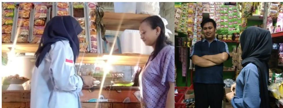
Gambar 4. Kegiatan wawancara kepada pelaku UMKM

pengembangan produk. Selain itu pelaku UMKM juga menganggap membuat pembukuan keuangan merupakan suatu hal yang merepotkan.