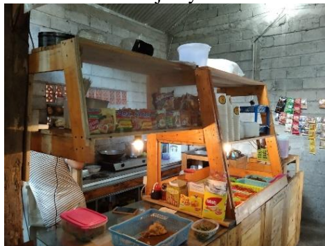
Gambar 3. Kegiatan observasi pada UMKM

Tahapan yang pertama adalah dengan melakukan observasi terhadap UMKM “Depot Degan Ndelik” dan “Toko 733 Mas Pras”. Dengan mendatangi langsung tempat yang akan dijadikan subjek PKL. Mengamati kegiatan yang dilakukan oleh pelaku UMKM saat menjalankan usahanya guna mendapatkan gambaran untuk tahap apa yang akan dilakukan selanjutnya.