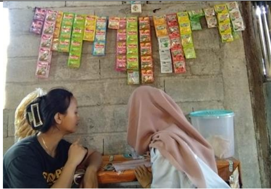
Gambar 6. Kegiatan pembimbingan dan pelatihan pembukuan sederhana