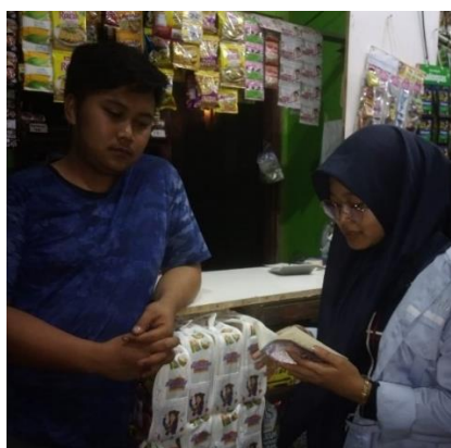
Gambar 5. Kegiatan edukasi dan penyuluhan terkait pembukuan sederhana

Melakukan penyuluhan terhadap pelaku UMKM yang ada di desa Karangduren, Kec. Tenganan, Kab. Semarang terkait dengan pembukuan sederhana, mulai dari pengertian, manfaat adanya pembukuan sederhana, isi dari pembukuan sederhana, dan bagaimana caranya menyusun pembukuan sederhana. Dari kegiatan ini pelaku UMKM masih belum mengetahui mana akun yang masuk debit dan mana akun yang masuk kredit. Dengan adanya edukasi terkait pembukuan sederhana, pelaku UMKM jadi paham akan pentingnya membuat pembukuan meskipun sederhana. Pembukuan merupakan pencatatan seluruh operasi yang dilakukan menurut kedudukannya masing-masing yang telah ditentukan. Pencatatan ini biasanya dilakukan secara rutin selama periode waktu tertentu dan memastikan bahwa semua transaksi, termasuk aset, modal, pendapatan, pengeluaran, dan hutang, dicatat secara akurat. Melakukan pembukuan meskipun dalam bentuk sederhana berguna bagi keberlangsungan suatu usaha, karena dengan adanya pembukuan dapat melihat kondisi keuangan suatu usaha, sehingga kedepannya dapat mengontrol keuangan usaha guna kemajuan usaha.