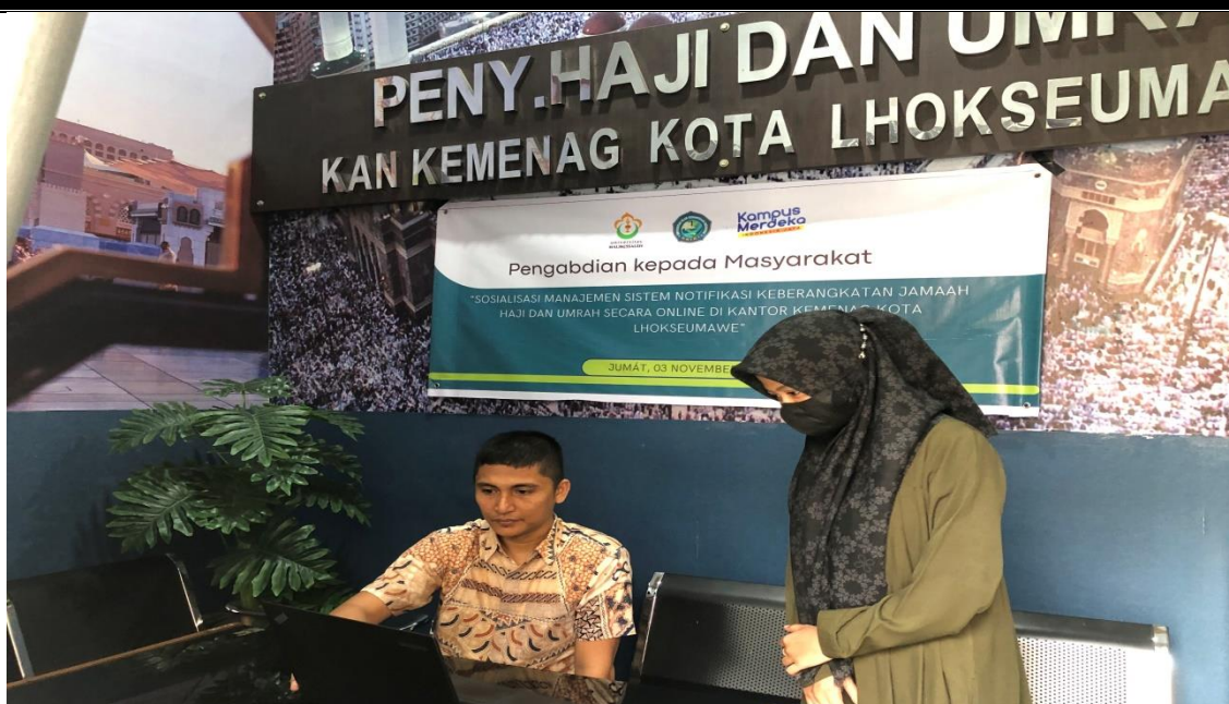
Gambar 3. Foto Kegiatan Pengabdian Sosialisasi Sistem Notifikasi Keberangkatan Jamaah Haji dan Umrah

Setelah menyelesaikan pelaksanaan kegiatan pengabdian, tim pengabdian melaksanakan wawancara untuk mengevaluasi pemahaman materi yang telah disampaikan. Berdasarkan hasil wawancara, sekitar 85% staf menyatakan kepuasan mereka terhadap pelaksanaan kegiatan pengabdian kepada masyarakat yang telah kami lakukan. Mereka mengungkapkan bahwa kegiatan ini telah memberikan wawasan yang berharga bagi mereka, terutama dalam hal penggunaan sistem notifikasi keberangkatan jamaah haji dan umrah. Sebelumnya, banyak di antara mereka tidak memiliki kemampuan untuk menggunakan aplikasi tersebut, namun setelah kegiatan ini, staf kini mampu menggunakannya dengan baik, sehingga mereka dapat lebih efektif dalam menyampaikan informasi kepada jamaah haji dan umrah.