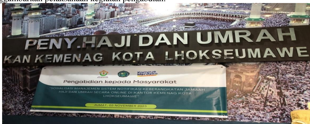
Gambar 2. Foto Spanduk Kegiatan Pengabdian

Kegiatan ini berlangsung di Bagian Penyelenggara Haji dan Umrah di Kantor Kemenag Kota Lhokseumawe dan diikuti oleh kelompok Pengabdian yang terdiri dari lima anggota serta sejumlah staf pegawai dari Bagian Haji dan Umrah di Kantor Kemenag Kota Lhokseumawe. Tim pengabdian menjelaskan kepada staf di Bagian Haji dan Umrah tentang manfaat sistem notifikasi online dalam meningkatkan efisiensi dan transparansi dalam proses keberangkatan jamaah Haji dan Umrah, terutama dalam konteks implementasinya di Kantor Kementerian Agama (Kemenag) Lhokseumawe. Berikut adalah beberapa gambar yang menggambarkan pelaksanaan kegiatan pengabdian.