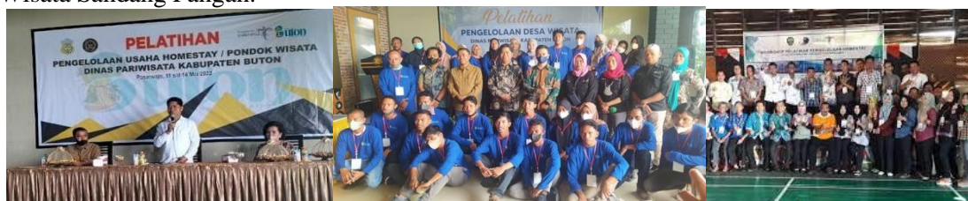
Gambar 7. Peran Government

yang memadai, wisatawan lebih cenderung memulai perjalanan dari Baubau dan kembali ke sana untuk beristirahat. Untuk meningkatkan daya tarik wisatawan, pemerintah Kabupaten Buton, melalui Dinas Pariwisata, secara rutin menyelenggarakan pelatihan pengelolaan usaha homestay atau pondok wisata setiap tahun. Ini menjadi solusi efektif dengan mengubah rumah warga menjadi hotel wisata. Dalam konteks ini, program desa wisata menjadi relevan, mengingat di desa tidak terdapat hotel, sehingga homestay menjadi opsi utama bagi para wisatawan. Ketua Bappera Sultra menekankan bahwa promosi wisata saat ini lebih mudah, dengan pemilik homestay atau pemerintah desa dan kecamatan dapat memanfaatkan media sosial untuk menawarkan paket wisata, memposting foto spot wisata, homestay, beserta tarifnya. Langkah ini diharapkan dapat menarik perhatian wisatawan dari luar daerah dan mendorong mereka untuk mengunjungi Desa Wisata Sandang Pangan.