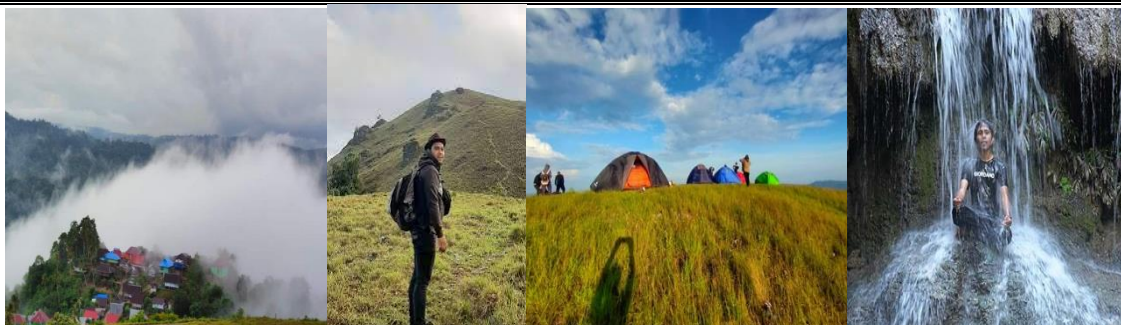
Gambar 1. Obyek Wisata Bukit Lamando dan Air Terjun Amajapo Desa Sandang Pangan