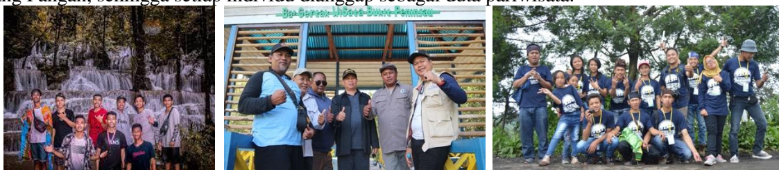
Gambar 6. Peran Community

Pada tahun 2022, Bukit Lamando mendapatkan nominasi dalam Anugerah Pesona Indonesia (API) sebagai dataran tertinggi yang paling populer. Keindahan alam di Bukit Lamando, seperti hamparan padang rumput dan pemandangan laut Banda yang memukau, menjadikannya destinasi yang sering dikunjungi oleh warga yang ingin menikmati kecantikan matahari terbit dan terbenam. Komunitas Ikatan Duta Wisata berfungsi sebagai akselerator dalam pengembangan Desa Wisata Sandang Pangan dalam model Pentahelix. Mereka bertindak sebagai perantara dan penghubung antara pemangku kepentingan untuk mencapai tujuan bersama. Peran utama dari komunitas ini adalah menyebarkan informasi dan mempromosikan Desa Wisata Sandang Pangan, sehingga setiap individu dianggap sebagai duta pariwisata.