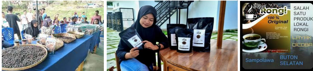
Gambar 5. Peran Business

fasilitator yang membantu Desa Wisata mempercepat peningkatan pertumbuhan ekonomi melalui produk-produk yang dihasilkan. Selain keindahan alam dan kekayaan budaya, Desa Sandang Pangan juga dikenal dengan produk kopi unggulannya, yakni kopi Robusta dari dataran tinggi kawasan tersebut. Salah satu UMKM terkemuka di desa ini, Rongi Kopi Premium, mengolah kopi dengan menggunakan mesin industri dan mengemasnya secara profesional. Produk kopi Rongi telah berhasil dipasarkan di berbagai kedai, tidak hanya di sekitar wilayah seperti Kota Baubau, Kabupaten Buton, Buton Tengah, dan Kota Kendari, tetapi juga di luar wilayah Sulawesi. Upaya menggerakkan sektor ekonomi kreatif dan mengembangkan potensi pariwisata merupakan fokus utama dari program kerja yang ditekankan oleh Pokdarwis Lamando Jaya.