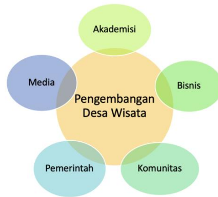
Gambar 3. Model Penta Helix

Desa Sandang Pangan memiliki sejumlah potensi wisata yang menarik, seperti hamparan padang rumput dan pemandangan laut Banda yang meluas dari puncak Bukit Lamando, menciptakan panorama alam yang memukau mata. Keberadaan lokasi yang mudah dijangkau dengan infrastruktur jalan yang memadai membuatnya menjadi tujuan populer bagi warga yang ingin menikmati keindahan matahari terbit dan terbenam. Selain itu, Air Terjun Bumbula Amajapo menjadi daya tarik alam utama dengan ketinggian sekitar 15 meter, hulu sungainya membentuk kolam, dan tebingnya dari batuan kapur memberikan suasana menakjubkan. Wisatawan seringkali menikmati keindahannya sambil mengabadikan momen dengan foto atau video. Keanekaragaman dan kekayaan potensi wisata tersebut menjadi keuntungan bagi masyarakat desa dan pemerintah, dan memerlukan inovasi dan perancangan dalam pengembangan Desa Wisata Sandang Pangan. Untuk mengoptimalkan potensi wisata di Desa Sandang Pangan, kolaborasi dari kelima aktor Model Pentahelix diperlukan. Akademisi, bisnis, masyarakat, pemerintah, dan media memegang peran masing-masing dalam pengembangan Desa Wisata Sandang Pangan, Kecamatan Sampolawa, Kabupaten Buton Selatan.(Asmiddin et al., 2022)