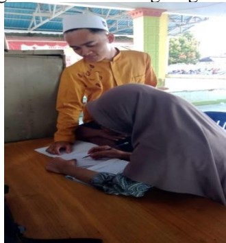
Gambar 2. Kegiatan les setelah pulang sekolah di posko

Dalam Membantu Kegiatan Proses Belajar Mengajar Di Sekolah Desa Tahai Baru, kelompok kami bergantian setiap harinya untuk membantu proses belajar mengajar disekolah-sekolah yang ada di desa Tahai Baru. Dalam proses pembelajaran, kami menggunakan media pembelajaran dan strategi pembelajaran yang dapat menarik perhatian peserta didik dan supaya materi pembelajaran yang kami sampaikan dapat diserap dengan baik. Setelah pulang sekolah, bagi peserta didik yang masih belum bisa membaca dan berhitung dapat mengikuti les di posko selama kegiatan KKN berlangsung.