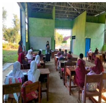
Gambar 3. Kegiatan Belajar Mengajar di SDN 2 Tahai Baru