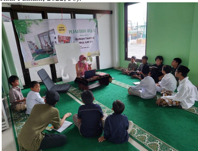
Gambar 3. Pengabdi ketika memandu acara refleksi diri.

Pemberian materi ini bertujuan untuk menumbuhkan nilai-nilai Islam berupa; kejujuran, tanggung jawab, taat, amanah. Para peserta diminta untuk membuat surat kepada orang tuanya masing-masing dengan mengemukakan perilaku maupun sifat yang kurang baik, disertai janji untuk memperbaiki diri. Dalam surat tersebut para peserta mengungkapkan kejujurannya bahwa mempunyai sifat-sifat yang kurang baik; seperti; malas, senang main game, berkata kotor, jahil, membuat rusuh, boros waktu, memarahi adik. Terhadap sifat yang kurang baik tersebut, berjanji akan menghilangkan sifat-sifat yang kurang baik tersebut. Internalisasi dari nilai-nilai keIslaman kepada remaja sangat penting untuk dilakukan, hal tersebut menjadi sebuah upaya dalam menangani atau mencegah terjadinya penyimpangan perilaku di kalangan remaja (Atika Rofiqatul Maula dan Sahrizal Fathani, 2022; 50).