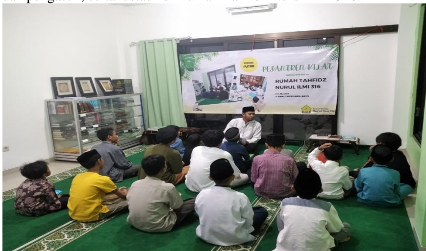
Gambar 2. Kegiatan taklim pesantren kilat di Rumah Tahfidz Nurul Ilmi 316.

Pesantren kilat telah dilaksanakan pada tanggal 3 sampai dengan tanggal 8 Juli 2023. Peserta sebanyak 17 orang, acara dibuka oleh ketua Yayasan Bhakti Haji 316 yang mengelola Rumah Tahfidz Nurul Ilmi 316, beserta pengurus dan pengasuh, serta ustadz di Rumah Tahfidz Nurul Ilmi 316.