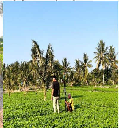
Gambar 8. Percobaan SIRCO

Apabila keterampilan dan kemampuan petani diukur menggunakan angka kuantitatif didalam perancangan dan pembangunan SIMORIKA dan SIRCO maka dapat dinyatakan sebesar 65%. Para produsen usahatani sudah mampu mengoperasikan SIMORIKA dan SIRCO. Namun permasalahannya adalah petani masih belum mampu merakit SIMORIKA dan SIRCO karena tingkat kesulitan bahan dan alat yang digunakan. Selain itu, petani juga mengalami kendala keterbatasan pengetahuan terkait dengan perbaikan teknologi apabila terjadi gangguan.