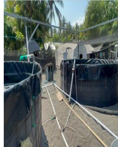
Gambar 5. Skema rancangan

Arsitektur sistem yang menggambarkan hubungan antar entitasnya ditunjukkan pada Gambar 1. Pembangunan Aplikasi SIMORIKA Berbasis IoT: Hardware: Mikrokontroler ESP32 (berkomunikasi dengan sensor-sensor dan Aerator, serta mengirim data ke WebHook), Modem Wifi GSM (mengkoneksikan ESP32 ke jaringan internet), sensor suhu (mengukur suhu air), sensor Water Level (mengukur ketinggian air), sensor DO (mengukur kadar Oksigen), sensor salinitas (kadar garam dalam air), sensor pH (mengukur pH air), Set solar panel (penyuplai energi listrik). Software: WebHook, Google Drive, Google Spreadsheet, Google Data Studio (penyimpanan database, penerapan IOT dan visualisasi data). Early Warning System: Sistem peringatan dini berupa alarm notifikasi pada aplikasi SIMORIKA dan juga pada aplikasi yang akan otomatis terkirim jika kualitas air di tambak buruk. Alat mitigasi (first aid): Mesin Aerator Ring Blower 370 watt (penyuplai oksigen), Pompa Air DC 200 Watt, Diffuser/Uniring aerasi, Pipa, kran selang dan selang.