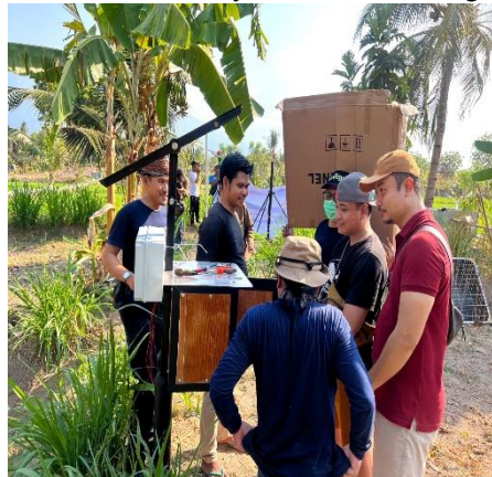
Gambar 7. Instalasi sensor