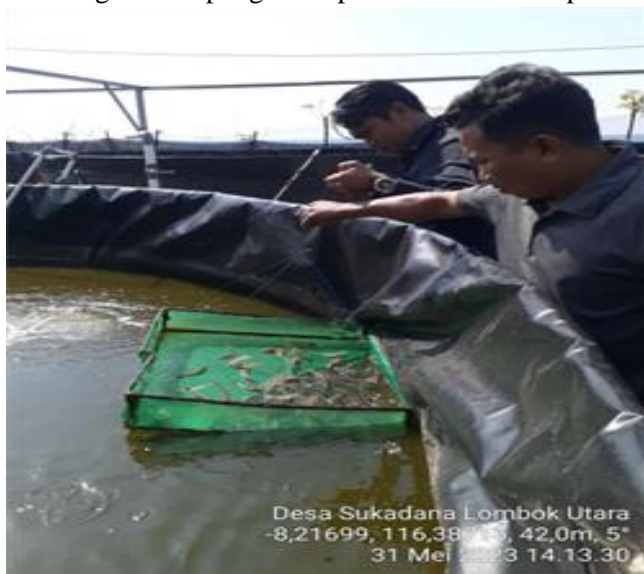
Gambar 1. Budidaya Udang Vaname

Profil lahan Kelompok Tani Mekar Tani yang berlokasi di Desa Sukadana Kecamatan Bayan adalah lahan kering. Tercatat data lahan kering belum difungsikan menjadi kegiatan produktif Desa Sukadana lebih dari 700 hektar. Melihat potensi pengembangan fungsi lahan kering menjadi produktif harus dan perlu dilakukan tindakan perbaikan sistem pertanian yang ada. Namun permasalahannya adalah karakteristik lahan kering membutuhkan supply air yang lebih banyak guna peningkatan produksi dan produktivitas. Sementara wilayah Sukadana memiliki sumberdaya air yang terbatas. Mereka hanya memanfaatkan sumur bor sebagai pemenuhan kebutuhan air tanaman. Selain itu, petani masih menggunakan teknik irigasi konvensional, yaitu dengan mengalirkan air dari sumur bor menggunakan pompa BBM menggunakan selang menuju lahan garapan, metode ini dianggap kurang efektif karena membutuhkan biaya produksi yang cukup tinggi terutama dari segi energi, SDM, dan waktu produksi, serta boros air. Dengan demikian diperlukan terobosan teknologi baru tepat guna seperti SIRCO untuk perbaikan produktivitas usahatani jagung.