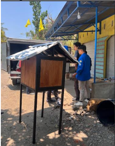
Gambar 3. Tempat Software

Pembangunan sistem dilakukan melalui beberapa tahapan yaitu 1) Quick Plan (perancangan sementara), 2) Modeling, Quick Design (perancangan alur, tabel, koneksi hardware dan perancangan interface visual, koneksi hardware dan software), 3) Construction of Prototype (pembangunan perangkat hardware, implementasi software, koneksi dengan telegram) , dan 4) pengujian sistem dan perangkat melalui Beta Testing.