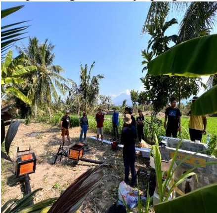
Gambar 6. Perancangan alat