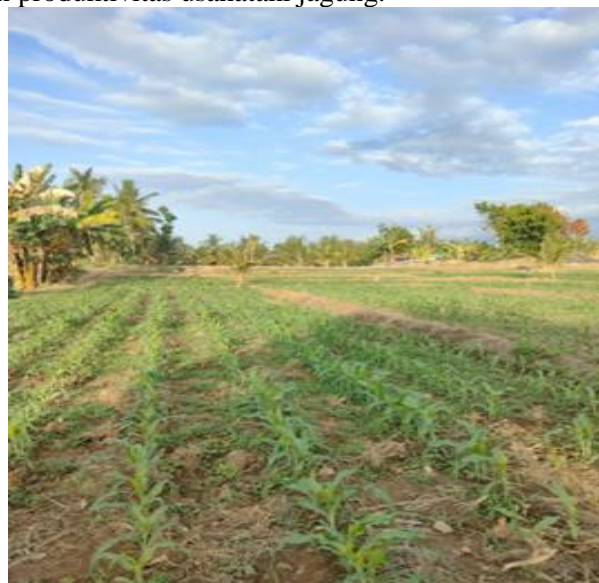
Gambar 2. Budidaya Usahatani Jagung

Aspek produksi komoditas budidaya udang vaname merupakan aspek yang sangat penting untuk diperhatikan oleh kelompok Pokdakan Putri Mandiri Dan Samudra Pelangi. Keberhasilan budidaya udang ditentukan oleh sarana produksi, baik kualitas maupun kuantitas, ketersediaan sarana produksi yang kurang baik akan mengakibatkan hasil produksi yang tidak memenuhi sasaran atau target. Permasalahan utamanya adalah belum tersedianya sistem peringatan dini (early warning system) dan monitoring kualitas air kolam secara real time (suhu, pH, kekeruhan, dan DO) yang dapat diakses secara langsung oleh setiap anggota kelompok/pembudidaya dalam menanggulangi kematian udang sebagai dampak penurunan kualitas air kolam secara drastis.