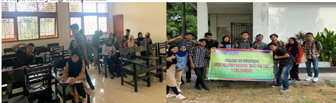
Gambar 2. Peserta Kegiatan Pengabdian

Hasil yang diperoleh dari kegiatan ini menunjukkan bahwa ada antusiasme positif saat dilakukan sosialisasi dan pendampingan sistem pencatatan akuntansi dasar, di antaranya: 1) pelaku usaha UMKM dapat memisahkan uang usaha dan uang pribadi, 2) peserta memiliki pemahaman dalam menganalisis bukti atau nota dalam transaksi bisnis pada usaha yang dijalani, 3) peserta mampu membuat jurnal hingga menyusun laporan keuangan sederhana sehingga pelaku UMKM dapat mengetahui jumlah laba atau rugi dari usahanya. Hasil kegiatan pengabdian ini sejalan dengan hasil kegiatan pengabdian yang dilakukan oleh (Sulaymah dan Astuti, 2023) yang menyatakan bahwa dengan adanya pelatihan pencatatan akuntansi maka pelaku usaha sedikit demi sedikit mulai bisa menyusun laporan keuangan sederhana sehingga bisa memberikan informasi tentang berapa laba yang didapatkan.