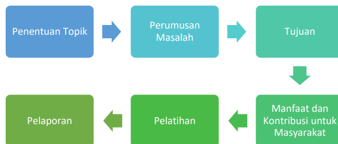
Gambar 1. Roadmap Kegiatan Pengabdian

Adapun tahapan kegiatan pengabdian kepada masyarakat tersebut di gambarkan pada roadmap berikut: