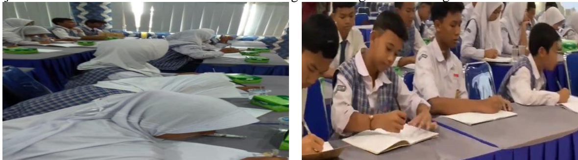
Gambar 6. Praktik Pengelolaan Uang

Pada pelaksanaannya, peserta tidak hanya diberikan materi, namun juga diberikan kesempatan untuk melakukan praktik mengelola keuangan menggunakan studi kasus. Adapun studi kasusnya yaitu pemateri memberikan gambaran kepada peserta seolah-olah mereka memiliki uang sebesar Rp. 100.000. Kemudian dari uang tersebut, peserta diminta untuk mengalokasikan uang sesuai urgensi pemakaiannya, yang terdiri dari 50% untuk kebutuhan, 30% keinginan dan 20% untuk tabungan. Praktik pengelolaan keuangan tersebut bertujuan untuk melatih siswa merencanakan atau mengatur keuangan sesuai dengan kebutuhan.