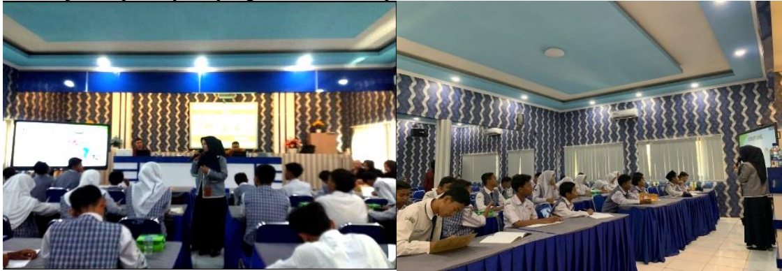
Gambar 5. Kegiatan Seminar Literasi Finansial

pengelolaan keuangan, dan tahap ketiga sesi tanya jawab. Pada tahap pertama, pemateri memaparkan materi dasar literasi finansial. Peserta diberikan pertanyaan pemantik seputar keuangan. Pemateri bertanya kepada perwakilan peserta baik dari perempuan maupun laki-laki mengenai barang atau benda apa yang pernah dibelinya. Setelah itu, pemateri menjelaskan konsep keuangan, bahwa keuangan merupakan hal primer yang menunjang kehidupan manusia dan perlu ilmu pengetahuan yang cukup dalam pengelolaannya. Antusiasme peserta dapat dilihat selama jalannya diskusi pada kegiatan seminar ini, para peserta aktif memperhatikan penjelasan materi yang diberikan, mencatat hal-hal penting yang berkaitan dengan literasi keuangan, dan turut aktif menjawab pertanyaan yang diberikan oleh pemateri.