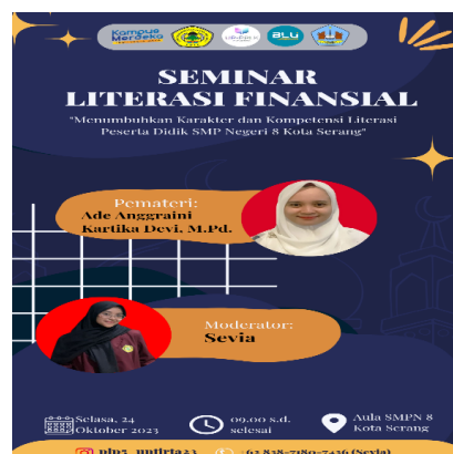
Gambar 3. Pamflet Kegiatan Seminar Literasi Finansial

Pada tanggal 24 Oktober 2023 dilaksanakan kegiatan Seminar Literasi Finansial yang bertemakan “Menumbuhkan Karakter dan Literasi Peserta Didik SMP Negeri 8 Kota Serang”. Peserta dalam kegiatan seminar ini berjumlah 30 orang yang berasal dari perwakilan setiap kelas. Pemateri dalam kegiatan ini disampaikan oleh Ibu Ade Anggraini Kartika Devi, M.Pd., selaku Dosen Pendidikan Bahasa Indonesia Untirta, dan dimoderatori oleh Sevia yang merupakan mahasiswa Pendidikan Bahasa Indonesia Universitas Sultan Ageng Tirtayasa. Kegiatan ini bertujuan untuk meningkatkan pengetahuan literasi keuangan dikalangan siswa dan mengedukasi cara mengelola keuangan dengan bijak. Pelaksanaan kegiatan ini ditunjukkan pada gambar 3.