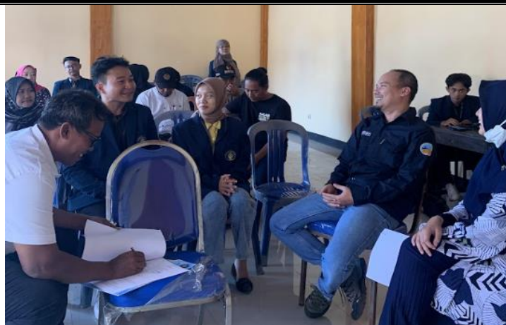
Gambar 3. Evaluasi Feasibility Study

Target luaran kegiatan pengabdian masyarakat ini yaitu penerbitan Hak Atas Kekayaan Intelektual (HAKI), berikut adalah indikator keberhasilan yang disusun selama pengabdian masyarakat dijalankan: