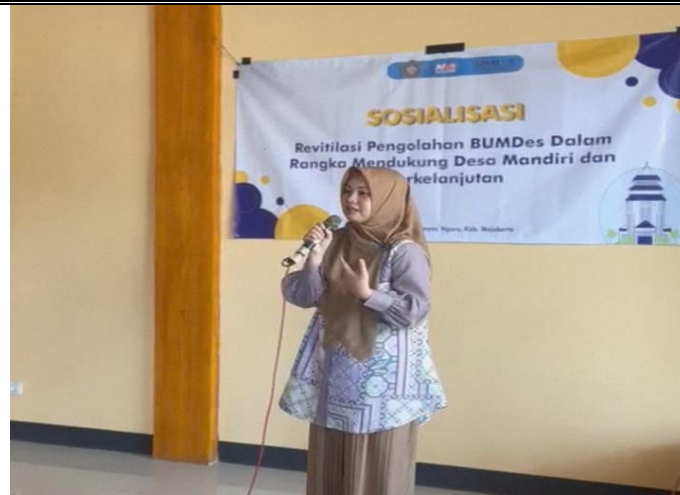
Gambar 1. Pemaparan materi AD/ART BUMDes

Pada minggu keempat, dosen pengabdian menjelaskan pentingnya BMC bagi pelaku usaha dan menjelaskan Langkah-langkah penyusunan BMC. Pada minggu tersebut mitra dibantu mahasiswa pengabdian mengumpulkan data yang dibutuhkan dalam penyusunan BMC yang akan dilaksanakan di minggu kelima. Pada minggu keenam, mitra bersama dosen pengabdian melakukan evaluasi bersama mengenai hasil penyusunan BMC di setiap BUMDes. Pada hari berikutnya setelah evaluasi, mitra bersama mahasiswa pengabdian memperbaiki BMC sesuai dengan hasil evaluasi BMC.