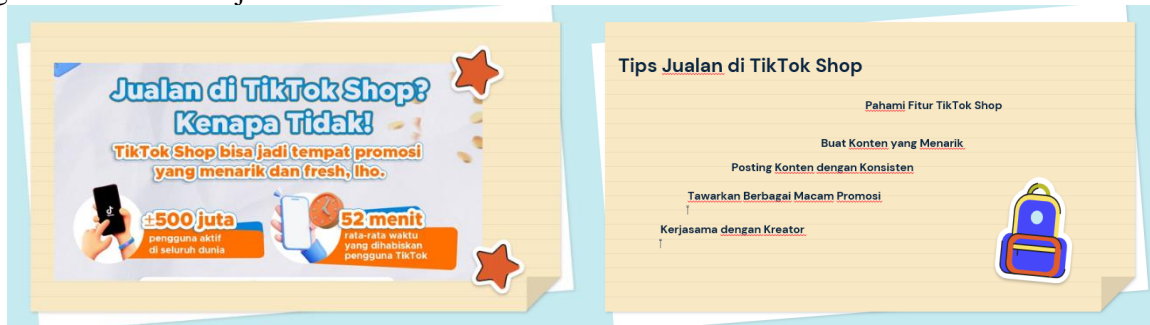
Gambar 3. Materi Pengabdian Kepada Masyarakat

disampaikan meliputi kegunaan aplikasi Tiktok, tren pemasaran saat ini, fitur-fitur yang terdapat dalam aplikasi Tiktok, cara meningkatkan penjualan melalui Tiktok Shop, keunggulan Tiktok, serta tips promosikan produk di Tiktok. Dari kegiatan ini, peserta banyak memberikan pertanyaan terkait penggunaan aplikasi Tiktok sebagai media promosi, karena yang peserta gunakan selama ini aplikasi Tiktok hanya sebagai media hiburan saja.