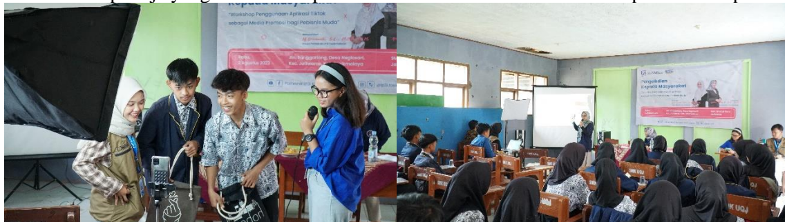
Gambar 4. Workshop Penggunaan Aplikasi Tiktok

Media promosi digital khususnya Tiktok menjadi pilihan efektif untuk pebisnis muda dalam mengembangkan bisnis dan menjangkau pasar nasional maupun internasional. Dengan menggunakan media digital, pebisnis muda dapat menjangkau calon konsumen yang lebih luas, tidak terbatas pada batas geografi sehingga ini menjadi solusi terbaik untuk melakukan promosi bagi para pebisnis muda.