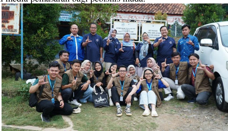
Gambar 1. Survei dan Koordinasi dengan Pihak Sekolah

Pemilihan SMK Ummul Quro Jatiwaras sebagai target dalam pelaksanaan Pengabdian Kepada Masyarakat merupakan keputusan yang tepat dengan skema fokus pada optimalisasi penggunaan aplikasi Tiktok. Berdasarkan paparan latar belakang di atas dapat diidentifikasi bahwa siswa/i jurusan Bisnis Daring dan Pemasaran (BDP) SMK Ummul Quro Jatiwaras belum memahami optimalisasi penggunaan Tiktok sebagai media pemasaran. Sementara itu banyak siswa/i yang menggunakan media digital ini hanya sebatas untuk hiburan saja namun belum mengerti bagaimana menggunakan teknologi ini secara bijak untuk mendukung kegiatan bisnis. Analisa mendalam dilakukan setelah dilakukannya survey dan koordinasi dengan pihak Kepala Sekolah, Wakil Kepala Sekolah, dan guru-guru yang ada di SMK Ummul Quro Jatiwaras. Dari hasil survey dan analisa yang dilakukan ternyata masih banyaknya siswa/i yang belum memahami kegunaan dari Tiktok sebagai upaya untuk memaksimalkan pemasaran produk, keingintahuan siswa/i terhadap fitur-fitur yang ada dalam aplikasi Tiktok sehingga dapat menunjang kegiatan pemasaran bagi pebisnis muda dan adanya keingintahuan untuk menggunakan media sosial tidak hanya sebagai media hiburan namun juga sebagai media pemasaran bagi pebisnis muda.