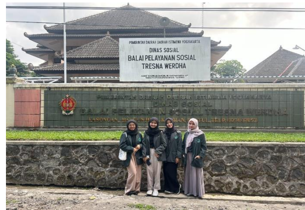
Gambar 2. Lokasi Pelatihan