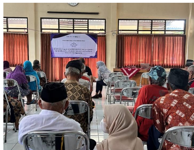
Gambar 4. Evaluasi Kegiatan Pelatihan

Sesuai dengan pendapat dari seligman dalam psikologi positif, Mindfulness merupakan salah satu aspek kebahagiaan masa ini yaitu sebagai emosi positif masa kini. Ukuran kebahagiaan adalah kepuasan kehidupan individu, yang merupakan sebuah perasaan puas pada internal individu (Uchida & Oishi, 2016). Penerapan mindfulness program pada lansia dapat menunjukkan lima aspek Mindfulness, yaitu (1) bertindak dengan kesadaran ( acting with awareness ); (2) kemampuan