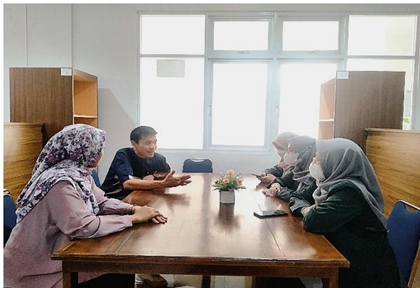
Gambar 1. Persiapan Pelatihan