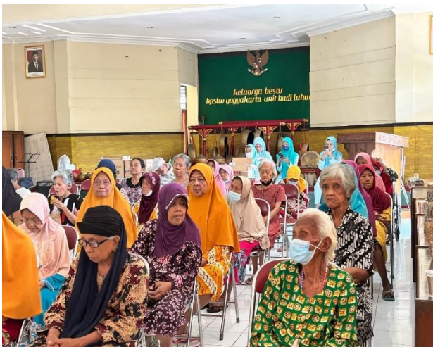
Gambar 3. Pelaksanaan Pelatihan

Berdasarkan penjelasan diatas bahwa pelatihan mindfulness program ini menunjukkan pengaruh yang positif pada Quality of Life dilihat dari adanya peningkatan yang baik setelah lansia diberikan pelatihan tersebut. Pada akhir sesi dari kegiatan pelatihan ini lansia terlihat lebih bersemangat, gembira, antusias, dan menerima diri untuk menjalani hidup yang sekarang hal tersebut menunjukkan bahwa lansia merasa lebih baik dari sebelumnya.