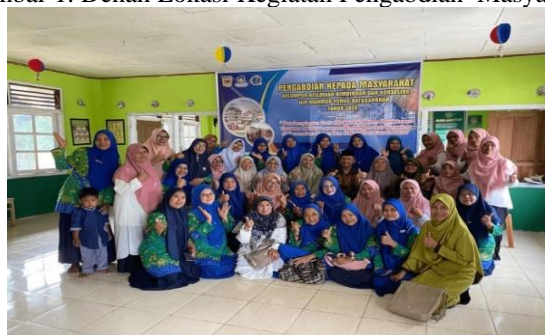
Gambar 2. Kegiatan PkM dengan guru-guru