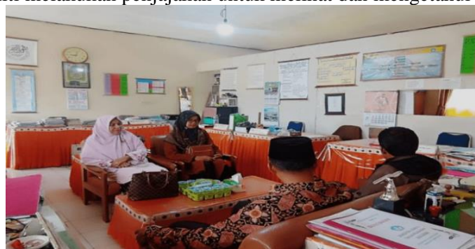
Gambar 4. Penjajakan/observasi lapangan

Pada tahap ini peneliti melakukan penjajakan untuk melihat dan mengetahui kondisi lapangan.