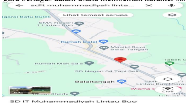
Gambar 1. Denah Lokasi Kegiatan Pengabdian Masyarakat

Tujuan dari kegiatan pengabdian ini adalah untuk melakukan pendampingan terhadap guru TK/PAUD dan SD dalam meningkatkan wawasan maupun keterampilannya memberikan layanan bimbingan dan konseling baik secara klasikal, kelompok maupun individual dalam pembinaan karakter siswa, sehingga bisa diaplikasikan ditempat guru-guru bertugas dalam usaha membentuk karakter siswa.