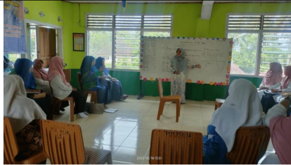
Gambar 6. Kegiatan lapangan