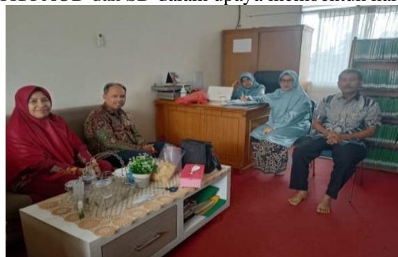
Gambar 5. Rapat perencanaan kegiatan bersama tim pengabdian

Pada tahap ini dilakukan perencanaan kegiatan yang akan dilakukan dalam rangka memberikan pendampingan kepada Guru TK/PAUD dan SD dalam upaya membentuk karakter siswa di sekolah