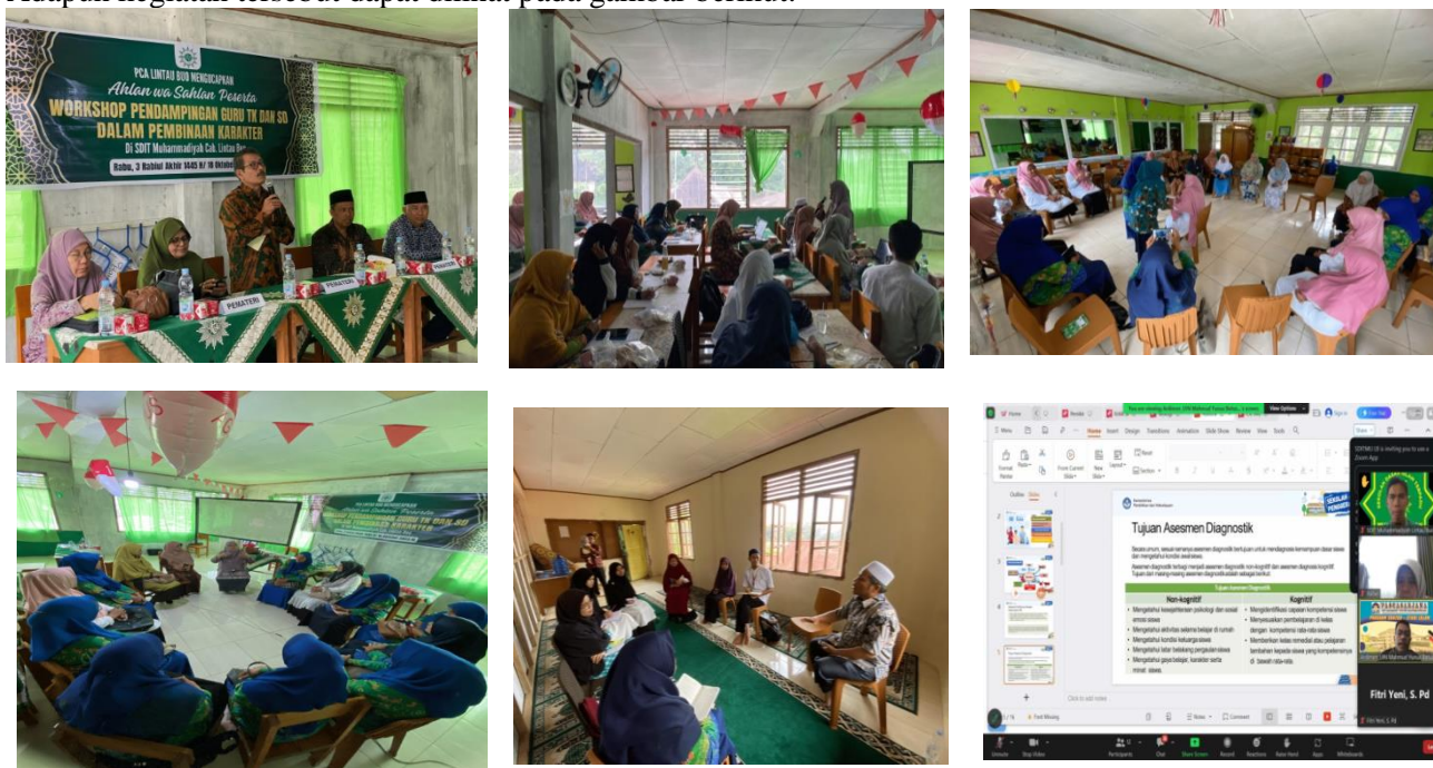
Gambar 7. Kegiatan pengabdian kepada Masyarakat kepada Guru tk/paud dan SD se-Lintau Buo kabupaten Tanah Datar

Setelah kegiatan lapangan diberikan guru-guru diminta mengaplikasikan ke siswa tempat mereka bertugas. Selanjutnya, sebagai wujud evaluasi dan tindak lanjut agar guru makin memperkuat kesadaran dalam mengaplikasikan ilmu yang sudah didapat, maka dilakukan pertemuan online melalui aplikasi zoom. Dalam kegiatan online ini diberikan materi tentang Asesmen dalam Implementasi Kurikulum Merdeka: Pondasi Pelaksanaan BK di Sekolah. Setelah materi diberikan dilanjutkan dengan diskusi terkait kegiatan yang sudah dilakukan di sekolah. Dalam hal ini diminta kesadaran guru dalam melaksanakan atau mengaplikasikan secara terjadwal kepada siswa. Adapun kegiatan tersebut dapat dilihat pada gambar berikut: