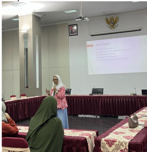
Gambar 1. Sambutan Pembuka Kepala Pengabdian Masyarakat.

Pelayanan masyarakat dilaksanakan pada hari Sabtu, 26 Agustus 2023, dari pukul 09.00 hingga 12.00, di ruang utama Gedung BRI. Peserta termasuk guru sekolah menengah dan atas yang telah mendaftar sebelumnya dan sengaja ditempatkan dalam kelompok kecil untuk memfasilitasi pembelajaran yang lebih efektif. Sebanyak 29 orang menghadiri acara tersebut, terdiri dari 7 guru sekolah menengah dan 22 guru sekolah menengah atas dari wilayah Malang Raya secara umum, dengan sebagian besar berasal dari sekolah swasta. Penyelenggara berharap adanya kehadiran kuat dari sekolah swasta, karena kemungkinan guru-guru tersebut memiliki sedikit kesempatan untuk pelatihan dalam penulisan makalah.