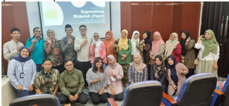
Gambar 3. Peserta inisiatif pengabdian masyarakat.

Peserta menunjukkan antusiasme yang mencolok selama acara, dengan hampir separuh dari mereka aktif berpartisipasi dengan pertanyaan dan komentar terkait kontennya. Menuju akhir program, peserta berbagi refleksi mereka, menyampaikan kepuasan besar dengan partisipasi mereka dalam inisiatif semacam ini. Mereka juga menyatakan keinginan kuat untuk penyelenggaraan reguler acara serupa, lebih baik 2-3 kali setahun, karena mereka melihat adanya kebutuhan signifikan untuk pengetahuan dan pelatihan dalam penulisan makalah, aspek kritis dari profesi mereka.