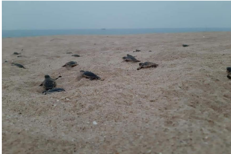
Gambar 1. Pantai Peneluran Penyu Sungai Belacan, Kecamatan Paloh Kalimantan Barat

khasiat telur penyu untuk meningkatkan stamina dan kesehatan. Eksploitasi dan pemanfaatan telur penyu secara masif dapat mengancam keberlanjutan dan kelestarian penyu.