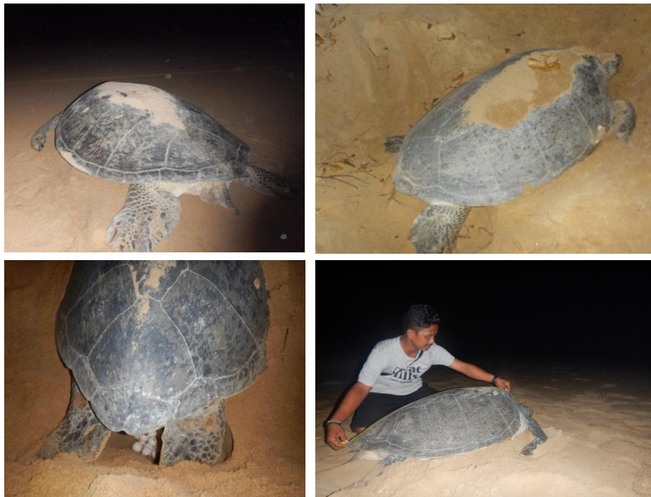
Gambar 5. Tahapan perilaku bertelur penyu hijau di Pantai Belacan, Desa Sebusus Kalimantan Barat

Setelah semua proses selesai, penyu akan kembali ke laut. Penyu memerlukan waktu >20 menit tergantung dengan jarak tempuh hingga ke perairan laut di lokasi tersebut