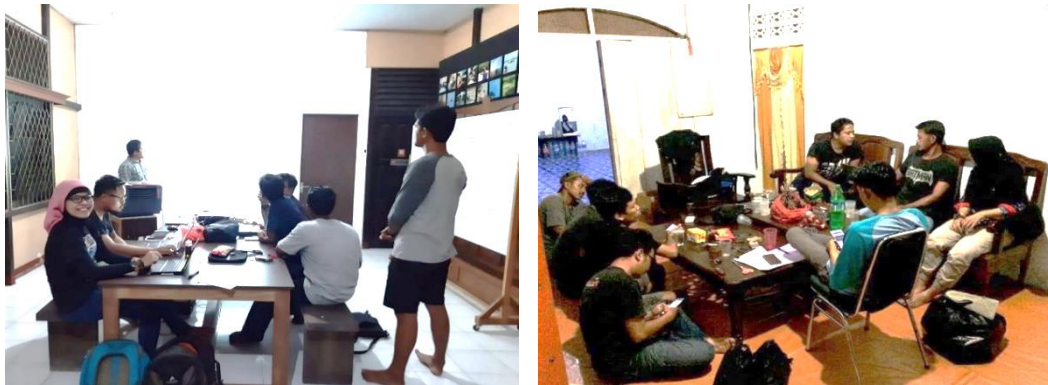
Gambar 2. Koordinasi dengan Kelompok Pengawas Wahana Bahari Paloh dan Yayasan WWF-Indonesia untuk kegiatan monitoring penyu di KKP3K Paloh