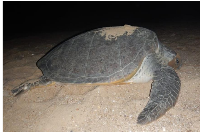
Gambar 4. Penyu hijau ( Chelonia mydas ) yang melakukan peneluran di Pantai Belacan Desa Sebusubus, Kecamatan Paloh

Di Kecamatan Paloh, penyu hijau dikenal dengan nama lokal Panyo' Kambau, dengan ciri khusus yaitu warna karapas kuning kehijauan atau cokelat kehitaman, bagian tepi karapas terdapat garis putih tipis. Bentuk cangkang oval/bulat telur apabila dilihat dari atas, ukuran kepala relatif kecil dan tumpul. Penyu jantan memiliki ekor lebih panjang dibandingkan penyu betina. Klasifikasi jenis penyu hijau, yaitu: