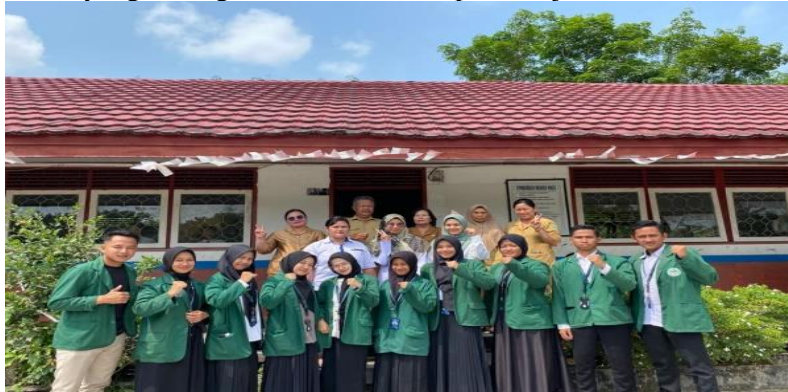
Gambar 1. SDN 1 Lungkuh Layang

masalah keluarga, terkendala ekonomi juga fasilitas belajar yang kurang memadai. Hal inilah yang kemudian menjadi sebab dilaksanakannya pengabdian ini yang tentunya bertujuan untuk meningkatkan minat dan motivasi belajar bagi siswa yang kurang termotivasi dalam pembelajaran.