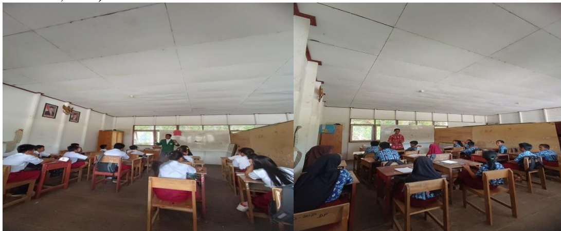
Gambar 2. Proses Pembelajaran di SDN 1 Lungkuh Layang

Problem Based Learning adalah pembelajaran yang menggunakan masalah autentik tidak terstruktur dan bersifat terbuka bagi peserta didik untuk mengembangkan keterampilan, menyelesaikan masalah dan berpikir kritis. Adapun sintaks dari PBM meliputi: 1) Orientation , 2) Organization , 3) Individual and Group Guiding , 4) Development dan 5) Analysis and Evaluation . Model pembelajaran PBL ini sangat sesuai digunakan untuk mengembangkan HOTS, karena tujuan utama dari PBL untuk merangsang kemampuan berpikir tingkat tinggi siswa. (Esti Untari, 2018)