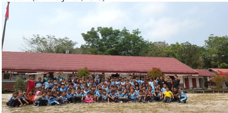
Gambar 3. Foto Bersama Peserta Didik SDN 1 Lungkuh Layang

pendapat. Motivasi belajar peserta didik perlu ditingkatkan secara kontinyu. Dengan cara meningkatkan motivasi belajar, tentunya akan berkorelasi dengan peningkatan minat yang berdampak terhadap keberhasilan pembelajaran. Diantara banyak faktor yang mempengaruhi keberhasilan belajar peserta didik, salah satunya adalah motivasi yang besar. Motivasi ini berperan sebagai pendorong dalam membangkitkan semangat belajar di sekolah. (Siti Nurjanah, 2023)