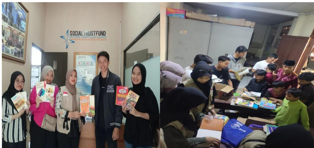
Gambar 4. Proses perapihan buku dan penerimaan buku donasi.

Program kerja bidang ekonomi yaitu bakti sosial atau lebih dikenal sebagai baksos merupakan salah satu kegiatan wujud dari rasa kemanusiaan antara sesama manusia. Program kegiatan tersebut. merupakan suatu kegiatan dimana dengan adanya kegiatan ini kita dapat merapatkan kekerabatan kita. Bakti sosial diadakan dengan tujuan- tujuan tertentu. Bakti sosial yang dilaksanakan di yayasan ini adalah untuk mewujudkan rasa cinta kasih, rasa saling menolong, rasa saling peduli kepada anak-anak yayasan yang sedang membutuhkan. Acara tersebut melibatkan seluruh anak-anak yayasan, pengurus yayasan, ketua yayasan setahun dosen pembimbing KKN.