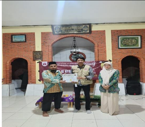
Gambar 5. Pelaksanaan baksos dan penutupan KKN.