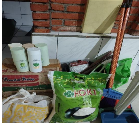
Gambar 1. Bantuan alat kebersihan dan makanan pokok