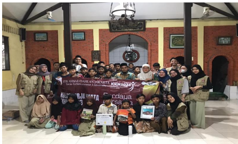
Gambar 6. Penutupan KKN

Program kerja bidang lingkungan yaitu pemberian alat-alat kebersihan. Program ini dilaksanakan agar memberikan efek baik kepada lingkungan yayasan. Dimana semua orang-orang di yayasan bisa menjaga kesehatan dan lingkungan dengan bersih. Seperti buang sampah pada tempatnya, menyapu ruangan tempat tidur, tempat ibadah, halaman, menyikat WC, membersihkan debu-debu serta mengepel ruangan yang kotor supaya terhindar dari berbagai penyakit.