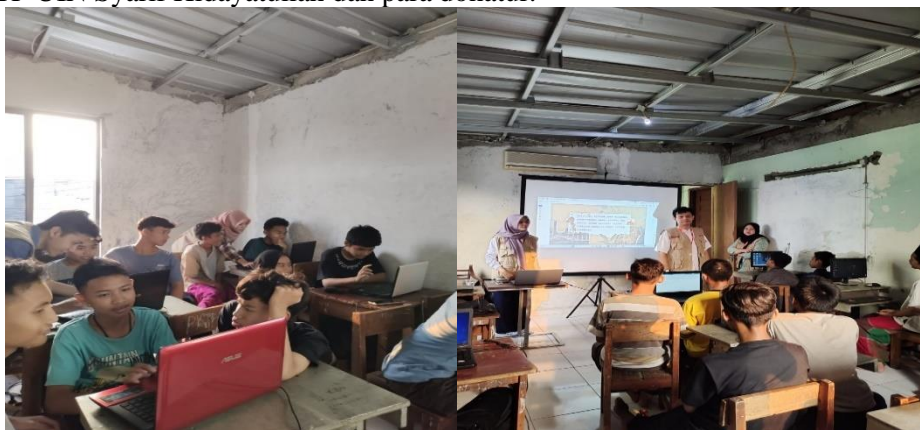
Gambar 3. Kegiatan sosialisasi dan pelatihan teknologi

Kegiatan ini cukup mendapat perhatian dari anak-anak yayasan yang menjadikan mereka gemar membaca. Program kerja bidang pendidikan yang dilaksanakan selama KKN mendapat apresiasi dan respon positif dari yayasan terkhusus anak-anak yayasan, pengurus yayasan dan ketua yayasan. Hal ini sangat membantu anak-anak yayasan bersemangat belajar dan cukup membantu memfasilitasi literasi. Kesuksesan penyelenggaraan program kerja ini tidak terlepas dari peran serta dan bantuan berupa alat, buku, dana dan bahan ajar yang berasal dari STF UIN Syarif Hidayatullah dan para donatur.