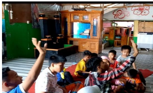
Gambar 3. Tanya jawab

Tahap selanjutnya, dilakukan fase tanya jawab. termin ini dilakukan dengan menanyakan pulang pada anak panti tentang materi yg belum dimengerti. Materi yang tak dimengerti akan dijelaskan pulang hingga mampu.