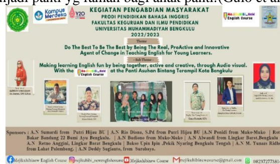
Gambar 1. Banner

Dengan demikikan sangat disayangkan Bila periode ini dilewatkan. pengajaran bahasa Inggris harus diberikan sedini mungkin sebab sosialisasi dini bisa menaikkan dominasi. Kompetensi bahasa Inggris sangat dibutuhkan buat mempersiapkan energi profesional yg mampu bersaing di era kemajuan ilmu pengetahuan dan teknologi pada warga . Akan sangat baik Jika semakin banyak orang yang tahu tentang pentingnya pengenalan bahasa Inggris di usia dini supaya mampu pemerolehan bahasa asing yang cepat tercapai. Belajar bahasa asing mempunyai beberapa keuntungan bagi anak-anak, antara lain menaikkan kemampuan komunikasi bahasa Inggris, mempromosikan pembelajaran budaya lain, meningkatkan keterampilan kognitif, menaikkan kesadaran akan konsep metalinguistik, meningkatkan motivasi, mendorong buat belajar, meningkatkan interkulturalisme, menumbuhkan pencerahan serta rasa kewarganegaraan global, dan menumbuhkan nilai-nilai yg menghargai keragaman. Mengatasi kesulitan atau kendala yang dimiliki anak panti agar potensi yg dimiliki anak panti bisa tersalurkan dengan baik. Panti Asuhan Bintang Terampil Bengkulu berusaha semaksimal mungkin buat menjadi panti yg ramah bagi anak panti.(Gulö et al., n.d.)