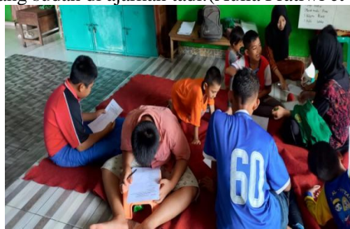
Gambar 5. Menjawab soal

Di tahapan terakhir ini anak diminta buat menjawab soal yg sudah dirancang oleh anggota MeJiKuHiBi_NeW English Course yg mengajar pada hari itu. Materi yang disampaikan dan di ulang kembali agar mampu lebih tau telah paham atau belum dan tanya jawab yg dilakukan dengan maksud melatih daya ingat anak panti perihal materi yang sudah di ajarkan tadi. (Aulia Pratiwi et al., 2022; Kamlasi, 2019)