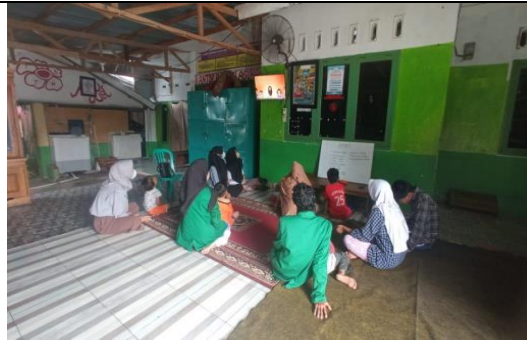
Gambar 4. Memutar video beserta musik