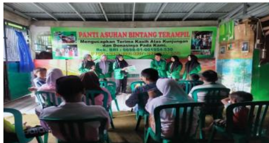
Gambar 2. Menjelaskan materi

Di awal pertemuan, anak panti berantusias buat mengikuti proses pembelajaran. Proses pembelajaran itu dilakukan menggunakan mengungkapkan materi yg akan dipelajari nanti. pada samping itu, dilanjutkan buat smengungkapkan materi kembali melalui audiovisual. setelah terselesaikan mengungkapkan materi, dilanjutkan untuk menanyakan pulang pada anak panti perihal materi yg belum dilahami.