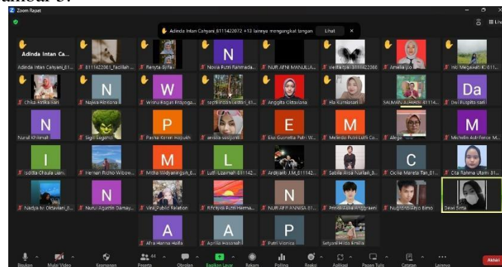
Gambar 4. Dokumentasi Kegiatan Sosialisasi