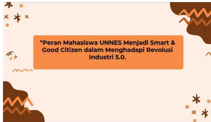
Gambar 3. Tampilan Power Point Materi Sosialisasi