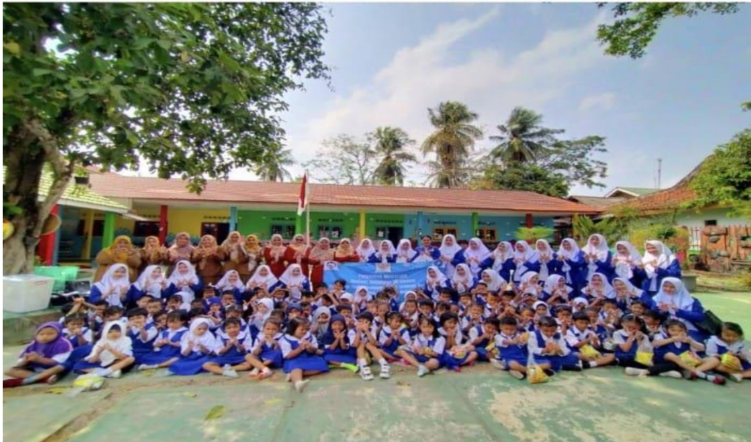
Gambar 1. Lokasi Kegiatan Pengabdian kepada Masyarakat