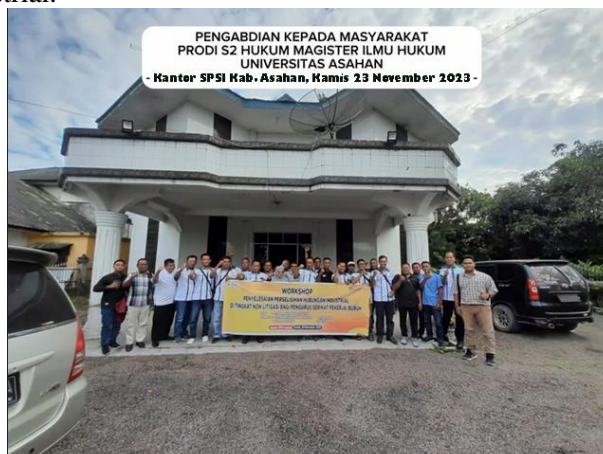
Gambar 4. Photo Bersama dengan Panitia dan Pemateri kegiatan serta Mitra PKM

Tampak antusias peserta dari kalangan serikat pekerja/serikat buruh di Kabupaten Asahan terkait dengan penyampaian materi yang dipaparkan oleh narasumber dengan merespon mengenai permasalahan-permasalahan yang sering terjadi di lapangan. Sesi penyampain materi kemudian diakhiri dengan diskusi melalui tanya jawab dengan mengedepankan ketentuan-ketentuan hukum yang berlaku dalam penyelesaian perselisihan hubungan industrial.