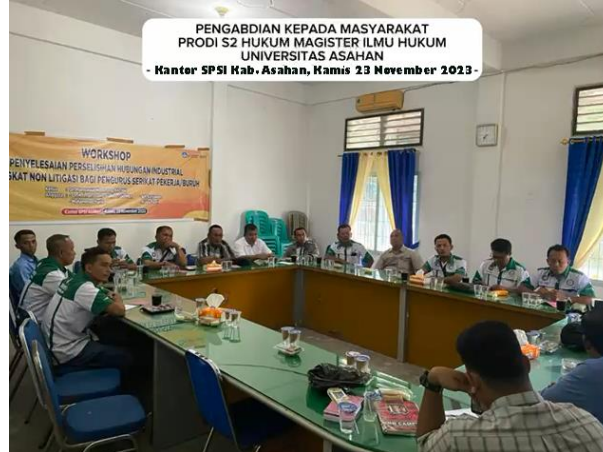
Gambar 3. Peserta Kegiatan Workshop Penyelesaian Hubungan Industrial di Tingkat non litigasi bagi serikat pekerja/serikat buruh

Tampak antusias peserta dari kalangan serikat pekerja/serikat buruh di Kabupaten Asahan terkait dengan penyampaian materi yang dipaparkan oleh narasumber dengan merespon mengenai permasalahan-permasalahan yang sering terjadi di lapangan. Sesi penyampain materi kemudian diakhiri dengan diskusi melalui tanya jawab dengan mengedepankan ketentuan-ketentuan hukum yang berlaku dalam penyelesaian perselisihan hubungan industrial.