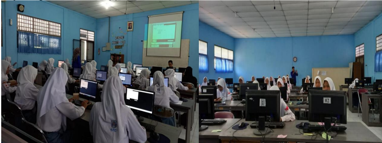
Gambar 4. Penyampaian Materi 2

menggunakan kasus “Rininda”. Materi yang mengenai langkah-langkah input data transaksi, input persediaan dari bahan baku, biaya tenaga kerja dengan aplikasi MYOB mulai dari menyiapkan data awal perusahaan sampai dengan membuat backup file .