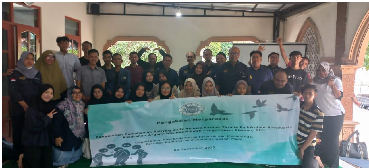
Gambar 2. Acara Penyuluhan Pemahaman Bullying pada Remaja Karang Taruna Padukuhan Randusari, Kalurahan Argomulyo, Kapanewon Cangkringan, Sleman, DIY pada tanggal 3 Desember 2023

Bullying atau perundungan merupakan fenomena yang banyak terjadi pada usia remaja dan anak usia sekolah. Penyuluhan kali ini tepat pada sasaran karena menyentuh kategori masyarakat yang sesuai, yaitu anak-anak dan remaja, di mana perundungan paling banyak terjadi (Putri, 2019). Dalam rentang umur di mana anak sedang berkembang secara fisik, mental, maupun sosial, penyuluhan ini sangat penting dilakukan dalam memastikan anak-anak Indonesia secara umum dapat tumbuh berkembang secara baik dan terbebas dari kekerasan. Hal ini merupakan bagian dari perlindungan anak, di mana diharapkan anak-anak dapat mendapatkan haknya untuk hidup, tumbuh dan berkembang, mendapatkan perlindungan dari segala bentuk kekerasan, eksploitasi, dan diskriminasi serta berpartisipasi dalam segala hal yang mempengaruhi hidupnya (Novianti, Nduru, R.Seto, Se'e, & Ansel, 2023).