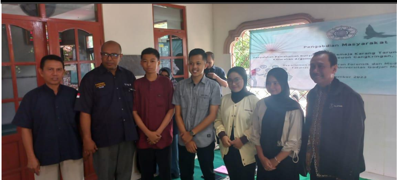
Gambar 1. Diskusi Narasumber dengan Anggota Karang Taruna Padukuhan Randusari