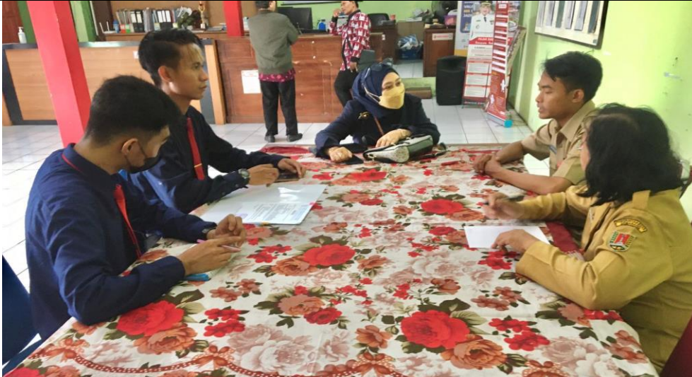
Gambar 1. Survey sekaligus diskusi tentang permasalahan Masyarakat sesuai dengan tema PKM

Gambar diatas merupakan gambar dimana tim pengabdian berdiskusi tentang seputar bagaimana kehidupan dimasyarakat setempat kelurahan Meteseh, serta berdiskusi tentang pekerjaan mayoritas Masyarakat setempat dsb.