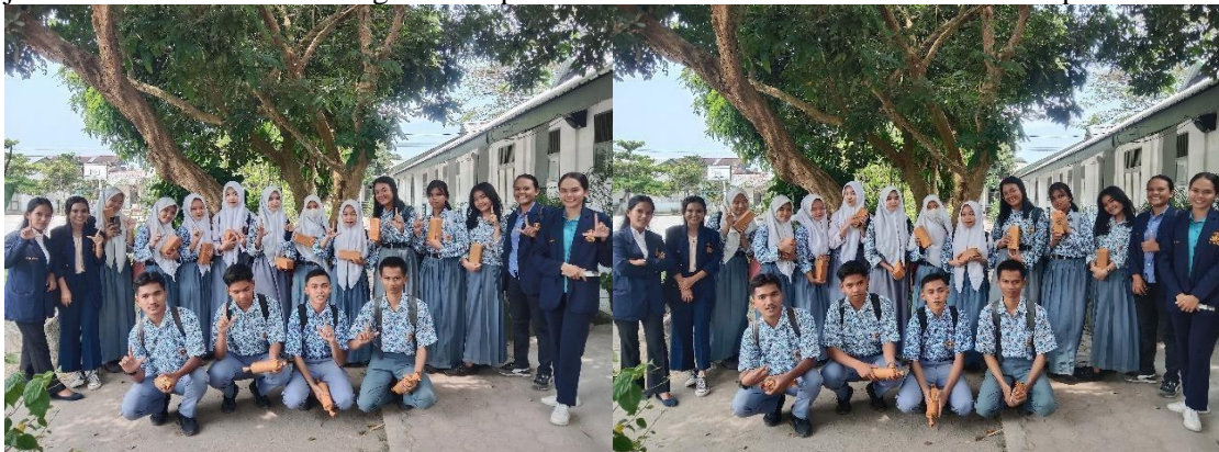
Gambar 3. Foto Bersama Siswa

Setelah para siswa melakukan tahapan-tahapan yang sudah kami paparkan atau jelaskan, selanjutnya kami melakukan tes atau latihan. Adapun tujuan kami melakukan tes atau Latihan adalah untuk mengetahui sejauh mana pemahaman mereka tentang duolingo. Kami memberikan tenggat waktu selama 10 – 15 menit. Setelah waktu habis, kami pun mencari satu siswa saja dari tiap kelas yang mendapatkan level tertinggi dalam mengerjakan latihan didalam duolingo. Kami pun mahasiswa PkM memberikan mereka apresiasi.