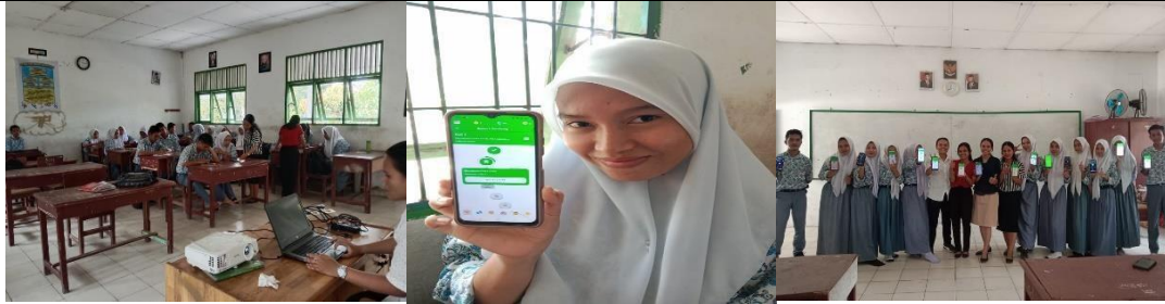
Gambar 2. Sosialisasi Pengenalan Software Duolingo

Kegiatan yang kami lakukan hari ini yaitu sosialisasi pengenalan software duolingo pada kelas XII IPA. Sebelum mengenalkan duolingo lebih jauh, terlebih dahulu kami menjelaskan apa itu aplikasi duolingo kepada siswa, dan menanyakan kepada siswa apakah mereka pernah mendengar aplikasi tersebut atau sudah pernah melihat sebelumnya. Setelah selesai terkait penjelasan aplikasi duolingo ini, maka kami langsung melakukan praktek atau penerapan langsung terkait penggunaan aplikasi duolingo kepada siswa. Setelah itu, kami menjelaskan cara – cara penggunaannya, fitur – fitur yang ada di aplikasi tersebut dan langsung diikuti oleh siswa. Setelah mereka sudah memahami aplikasi tersebut, kami melaksanakan tes untuk mengetahui sejauh mana pemahaman mereka terkait aplikasi tersebut. Kami melaksanakan tes selama 10-15 menit, setelah waktunya habis kami mencari siswa yang levelnya tertinggi. Siapa yang levelnya paling tinggi maka dialah pemenangnya.