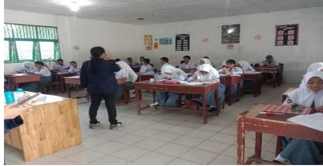
Gambar 1. Kegiatan PkM