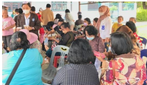
Gambar 2. Panitia dan Peserta Penyuluhan