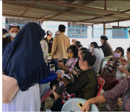
Gambar 1. Panitia dan Peserta Penyuluhan