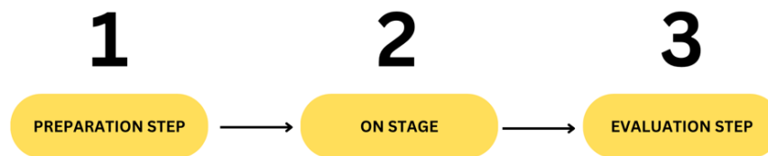
Gambar. 2. Tahapan Kegiatan Pengabdian

Siaran secara langsung ini diselenggarakan dengan durasi 60 menit, yang diselingi dengan jeda dan sesi tanya jawab pada bagian pertengahan dan akhir acara. Untuk tetap memberikan suasana yang nyaman kepada para pendengar, sesi siaran diselingi juga dengan pemutaran musik dengan selera anak muda sehingga topik pembicaraan yang membahas materi keuangan menjadi tidak kaku dan rumit. Upadana & Herawati, (2020) menjelaskan bahwa materi yang baik adalah materi yang dipaparkan dengan bahasa yang sederhana sehingga semua kalangan dapat memahami apa yang disampaikan oleh pengirim pesan. Ada pun urutan tahapan pada kegiatan pengabdian ini adalah dimulai dari tahap persiapan atau preparation step , pelaksanaan atau on stage , dan evaluation sebagai rangkaian akhir kegiatan. Tahapan evaluasi sangat perlu untuk dilakukan agar kegiatan pengabdian dapat menjadi lebih baik dari waktu ke waktu.