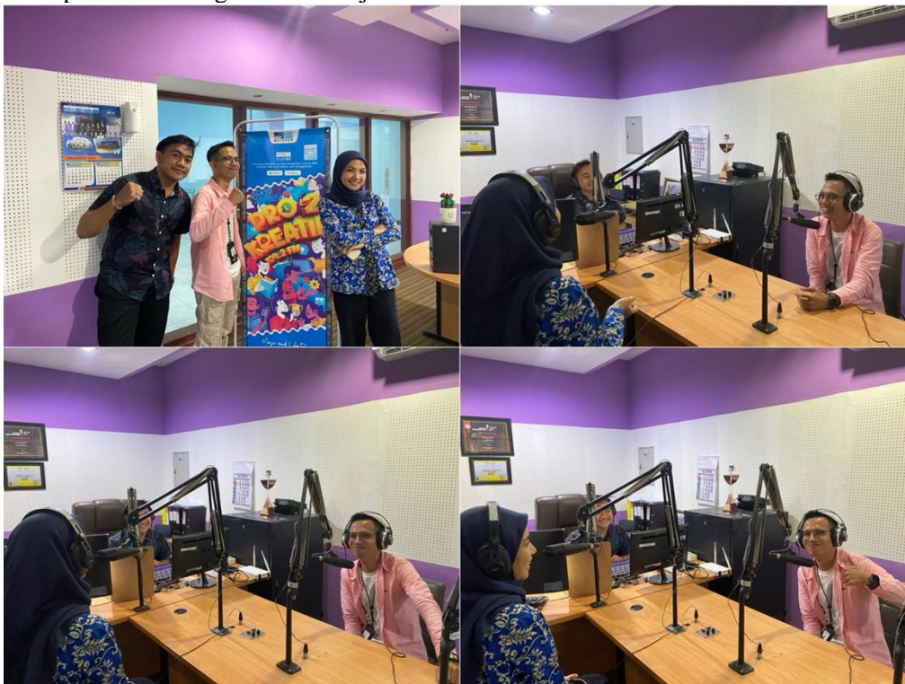
Gambar. 3. Kegiatan Siaran

Tahapan ini adalah tahapan inti dari kegiatan pengabdian. Pada bagian ini, penulis memaparkan materi terkait literasi keuangan yang membahas topik khusus mengenai piramida keuangan. Konsep piramida keuangan ini merupakan konsep keuangan yang menjelaskan bahwa setiap kebutuhan memiliki prioritasnya masing-masing, oleh karenanya anggaran keuangan pun harus disusun sesuai dengan skala prioritasnya masing-masing. Pradinaningsih & Wafiroh, (2022) menjelaskan bahwa anggaran yang disusun sesuai dengan urutan waktu akan dapat lebih terukur dan mudah dikelola. Hal ini tentunya akan membuat keputusan keuangan akan menjadi lebih baik dan efisien.