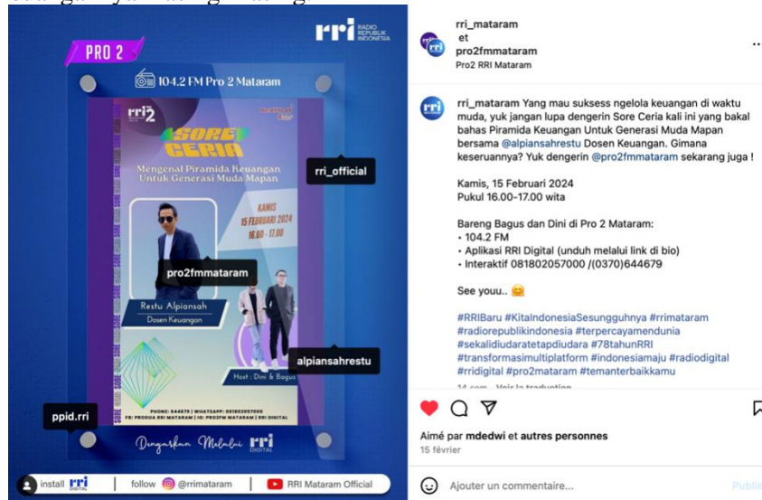
Gambar. 1. Poster Kegiatan

tujuan masing-masing pada naskah siaran, sehingga akhirnya tercipta naskah siaran yang siap untuk disebarluaskan kepada masyarakat. Pelaksanaan kegiatan dilakukan secara langsung atau Live di studio RRI Pro 2 yang beralamat di Jalan Langko, Nomor 83 Mataram, Nusa Tenggara Barat pada tanggal 15 Februari 2024. Kegiatan pengabdian ini disusun dengan konsep yang sederhana namun tetap berkomitmen memberikan dampak yang luas kepada masyarakat umum. Target pendengar secara umum adalah masyarakat Nusa Tenggara Barat, namun secara khusus siaran ini diberikan kepada generasi muda. Alasan generasi muda perlu diberikan atensi khusus adalah agar para generasi muda yang baru memiliki pekerjaan dapat lebih peka lagi dalam mengelola keuangannya masing-masing.