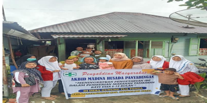
Gambar 1. Foto Bersama dengan Masyarakat

Masih terdapat kasus di mana ibu Di Desa Gunung Tua Tonga Kabupaten Mandailing Natal kurang memahami pentingnya makanan tambahan yang sehat dan bergizi bagi pertumbuhan optimal bayi mereka.