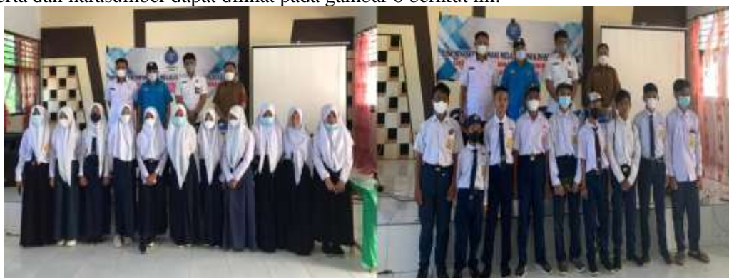
Gambar 6. Foto bersama kegiatan sosialisasi

Setelah pemberian materi oleh narasumber maka peserta diberikan kesempatan untuk bertanya dan melakukan diskusi pada sesi tanya jawab. Peserta sangat antusias dalam bertanya kepada narasumber mengenai materi tentang bahaya dan dampak narkoba. Dalam kegiatan sosialisasi, penyampaian materi oleh narasumber menggunakan metode asosiasi yaitu menyampaikan materi berdasarkan fakta dan kejadian di lapangan serta pengalaman anggota BNN dalam menangani kasus penyalahgunaan narkoba. Metode asosiasi yang digunakan dalam memberikan materi sosialisasi dinilai efektif terhadap peningkatan wawasan dan pengetahuan peserta mengenai bahaya penyalahgunaan narkoba (Putra, 2018). Sharing pengetahuan berdasarkan pengalaman narasumber dalam menangani anak dan remaja yang terjerumus kedalam penyalahgunaan narkoba menjadi daya tarik dan antusiasme bagi peserta untuk mengetahui cara mencegah dan menolak narkoba di lingkungan sekolah dan masyarakat. Peserta menjadi bersemangat melakukan aktifitas positif dan mendapat dukungan untuk berani melaporkan sekiranya melihat kejadian penyalahgunaan narkoba di lingkungan sekitarnya. Setelah sesi Tanya jawab selesai maka kegiatan diakhiri dengan sesi foto bersama antara peserta, tamu undangan dan narasumber. Gambaran kegiatan foto bersama antara peserta dan narasumber dapat dilihat pada gambar 6 berikut ini.