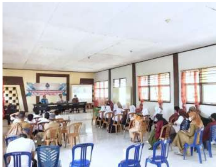
Gambar 4. Pelaksanaan acara Pembukaan oleh Kepala BNN Kabupaten Maluku Tengah

Setelah semua kegiatan koordinasi dilakukan demi kelancaran kegiatan sosialisasi, maka ditetapkan waktu dan tempat pelaksanaan kegiatan sosialisasi bahaya penyalahgunaan narkoba pada hari di aula SMP Negeri 72 Maluku Tengah. Pada hari H pelaksanaan kegiatan sosialisasi, kegiatan dimulai dengan acara pembukaan. Acara pembukaan dibuka oleh Kepala BNN Kabupaten Maluku Tengah bapak Irjen Pol Marthinus Hukum. Dalam sambutan Kepala BNN Kabupaten Maluku Tengah, mengajak semua elemen masyarakat untuk ikut mengambil peran dalam melakukan upaya preventif terhadap bahaya penyalahgunaan narkoba dikalangan anak dan remaja mengingat penyalahguna narkoba didominasi oleh golongan pelajar. Gambaran acara pembukaan kegiatan sosialisasi bahaya penyalahgunaan narkoba dapat dilihat pada gambar 4 berikut ini.