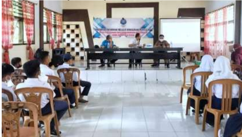
Gambar 5. Pemberian materi oleh narasumber

pengecegan dan penanggulungan penyalahgunaan narkoba dikalangan anak dan remaja. Gambaran pemberian materi oleh narasumber dapat dilihat pada gambar5 berikut ini.