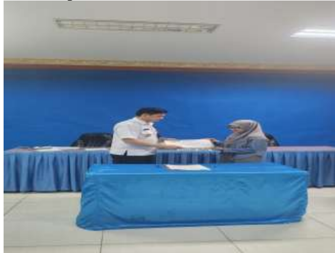
Gambar 3. Kordinasi Dengan BNN Kabupaten Maluku Tengah

Kabupaten Maluku Tengah terkait permohonan narasumber dan kesediaan memberikan sambutan sekaligus membuka acara kegiatan sosialisasi bahaya penyalahgunaan narkoba. Berikut ini gambaran koordinasi dengan BNN Kabupaten Maluku Tengah.