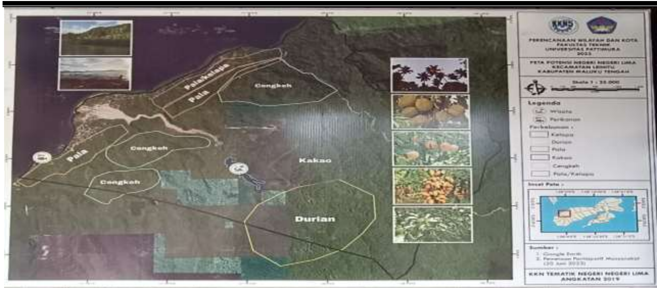
Gambar 1. Peta Desa Negeri Lima