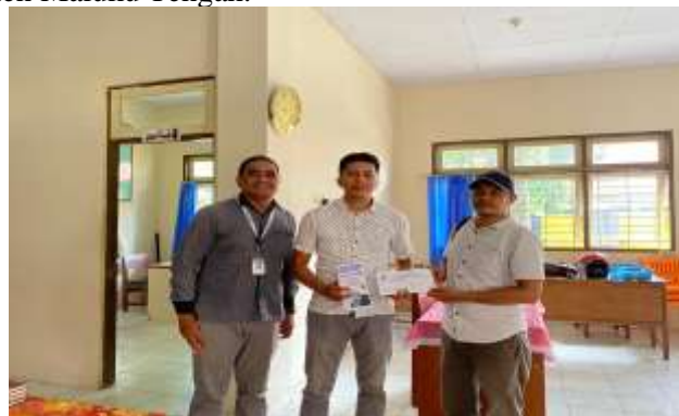
Gambar 2. Kordinasi Dengan Kepala Sekolah SMP Negeri 72 Maluku Tengah

Kegiatan sosialisasi bahaya penyalahgunaan narkoba dilaksanakan di Sekolah Menengah Pertama (SMP) Negeri 72 Maluku Tengah dimulai dengan melakukan persiapan dan koordinasi dengan kepala sekolah SMP Negeri 72 Maluku Tengah dan BNN Kabupaten Maluku Tengah. Koordinasi dilakukan dengan tujuan agar kegiatan sosialisasi dapat berjalan dengan baik dan memperoleh dukungan dari berbagai pihak yang terlibat di dalam kegiatan sosialisasi tersebut. Berikut ini gambaran koordinasi dengan Kepala sekolah dan BNN Kabupaten Maluku Tengah.