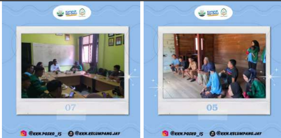
Gambar 1. Perizinan Sosialisasi kepada Aparatur Desa