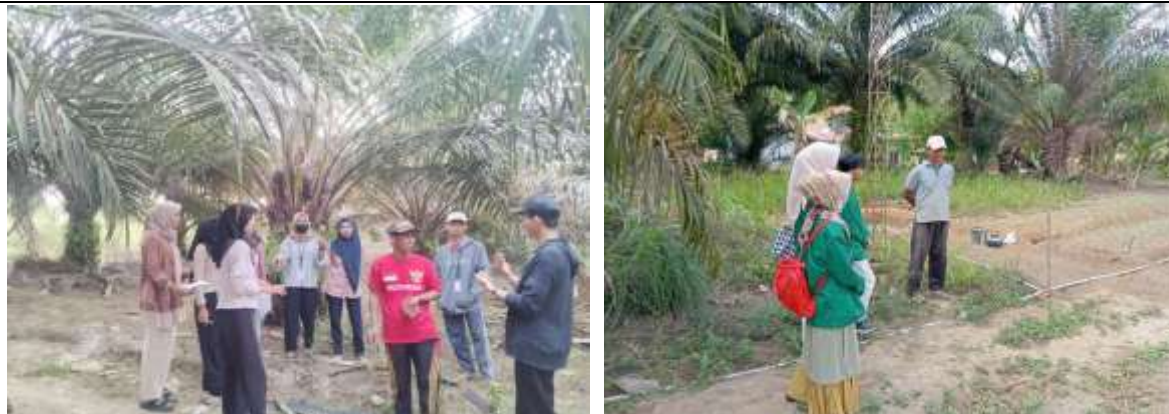
Gambar 2. Melakukan Sosialisasi kepada Pekebun Kelapa Sawit