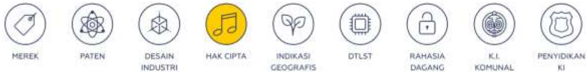
Gambar 2. Macam-macam Kekayaan Intelektual

Dari data di atas memperlihatkan bahwa sebagian peserta masih awam pengetahuan tentang hak kekayaan intelektual. Bagi mereka, hak cipta adalah hak yang mencakup keseluruhan karya seperti produk, desain, bangunan, dan merek yang telah terdaftar secara hukum. Padahal, Direktorat Jendral Kekayaan Intelektual memaparkan informasi dari macam-macam Kekayaan Intelektual seperti merek, paten, desain industri, hak cipta, indikasi geografis, DTLST, Rahasia Dagang, K.I Komunal, Penyidikan KI. Itu artinya peserta umumnya mengartikan Hak Kekayaan Intelektual adalah Hak Cipta. Padahal Hak Cipta adalah bagian dari Hak Kekayaan Intelektual.