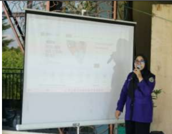
Gambar 3. Tim memberikan edukasi berupa pemberian materi tentang HKI

Pemaparan tentang HKI dijelaskan satu persatu agar informasi yang selama ini diketahui oleh peserta tidak meragukan lagi. Di dukung dari website DJKI, tim menjelaskan sekaligus memperkenalkan website tersebut. HKI yang banyak dijelaskan oleh tim yaitu merek, hak cipta, dan fotografi sebagai hak cipta. Dua pembahasan tersebut ditekankan dalam edukasi tersebut karena merek berhubungan dengan identitas produk atau dagang para peserta sebagai pelaku UMKM, sedangkan hak cipta berhubungan dengan promosi produk mereka yang berupa foto dan video yang dipublikasi di media sosial.