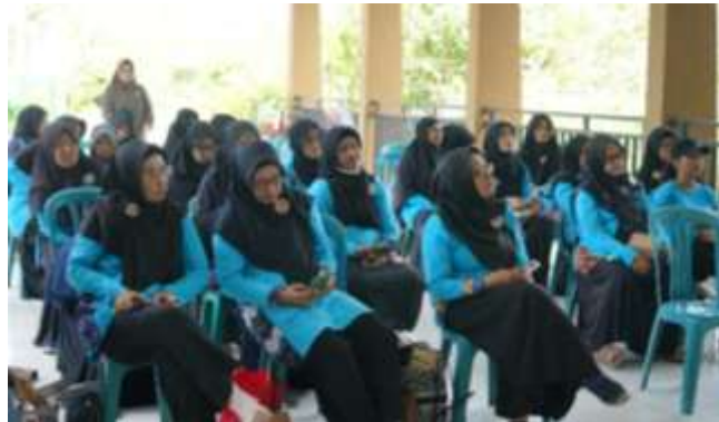
Gambar 5. Para peserta mengikuti materi HKI

Disana ada beberapa hal yang perlu dipersiapkan dalam mendaftarkan merek mereka seperti label merek, tanda tangan pemohon, surat edaran UMK (Usaha Mikro dan Usaha Kecil), Surat pernyataan UMK bermaterai, dengan biaya yang dibebankan oleh pendaftar.