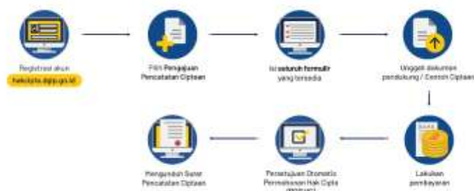
Gambar 6. Prosedur pendaftaran HKI hak cipta

Para peserta cukup serius mengikuti jalannya acara. Hal itu dikarenakan produk yang mereka miliki perlu dilakukan pematangan agar dapat bertahan lama. Selain itu, edukasi juga memberikan mereka persiapan untuk melindungi merek dan hak cipta yang mereka buat kedepannya. Selanjutnya, tim juga menjelaskan tentang produser pendaftaran hak cipta seperti fotografi. Alur tersebut tidak jauh berbeda dengan alur pendaftaran merek sebelumnya, perbedaannya ada pada karya yang ingin didaftarkan.