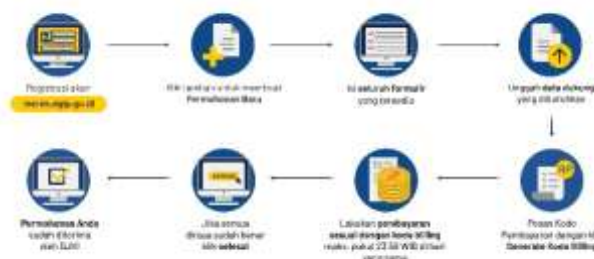
Gambar 4. Prosedur pendaftaran HKI merek

Tim menemukan bahwa para peserta banyak yang salah paham tentang Hak Intelektual dan Hak Cipta, sehingga dengan edukasi ini penjelasan tentang keduanya dapat dijelaskan secara jelas. Selain itu, tim juga menemukan bahwa untuk mendaftarkan karya seperti fotografi satu kali dalam jumlah banyak, sehingga tim memberikan edukasi bahwa dalam mendaftarkan karya cipta di website DJKI masing-masing perlu didaftarkan satu persatu. Hal itu yang kemudian memberatkan mereka karena foto yang mereka ambil selama ini dalam jumlah banyak, sehingga tim memberikan solusi untuk mengambil foto dengan persiapan konsep foto, pencahayaan, serta properti pendukung yang matang. Hal itu bertujuan agar foto yang dihasilkan cukup untuk mewakili produk yang mereka jual.