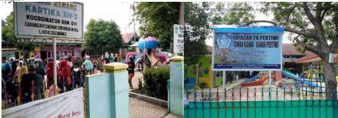
Gambar 1. Lokasi Kegiatan

Berdasarkan uraian diatas permasalahan yang sangat serius dan perlu solusi nyata adalah Bagaimana sosialisasi hukum yang efektif dapat membangun kesadaran sejak dini pada anak-anak terhadap dampak negatif bullying di lingkungan taman kanak-kanak? Bagaimana pendekatan yang tepat dalam sosialisasi hukum dapat meningkatkan keberanian anak-anak untuk melaporkan tindakan bullying dan menciptakan lingkungan yang aman dan positif? Sejauh mana sosialisasi hukum dapat berkontribusi dalam mengurangi kasus bullying di kalangan anak-anak usia dini dan membentuk generasi yang lebih peduli dan saling menghargai?