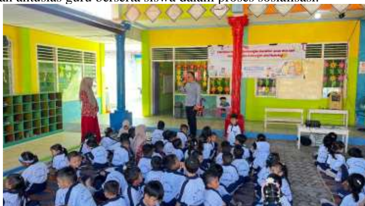
Gambar 2. Kegiatan Sosialisasi pada Taman Kanak-kanak Pertiwi