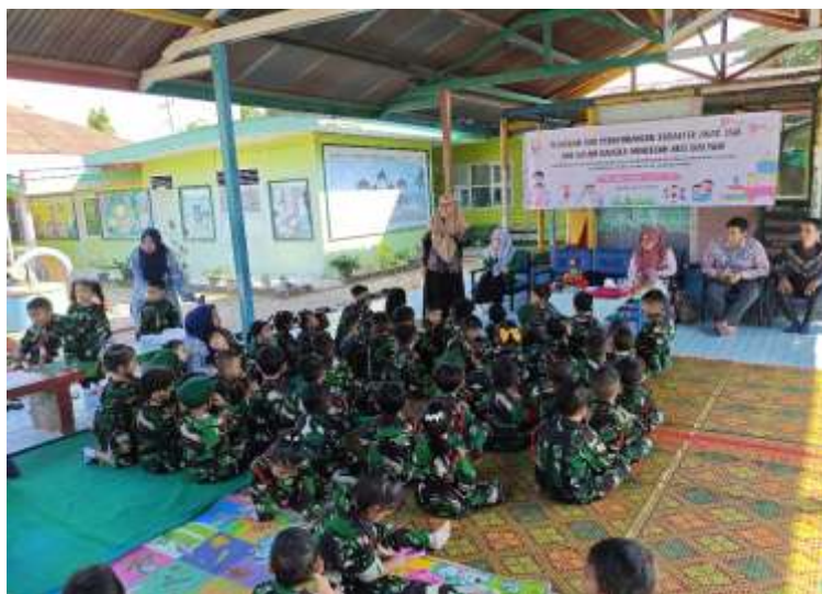
Gambar 3. Kegiatan Sosialisasi pada Taman Kanak-kanak Kartika XIV-3