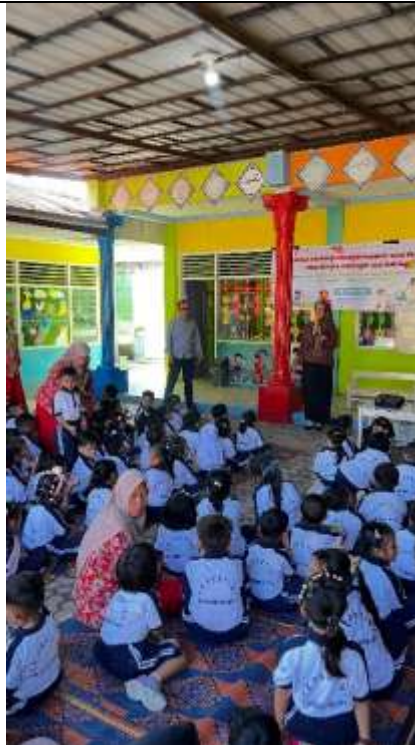
Gambar 4. Kegiatan Sosialisasi

Peserta kegiatan sangat antusias mendengarkan paparan materi sosialisasi. Pemateri memaparkan materi secara interaktif dan memberikan doorprize bagi peserta yang dapat memberikan keterangan atau contoh aktivitas bullying dari gambar power point.