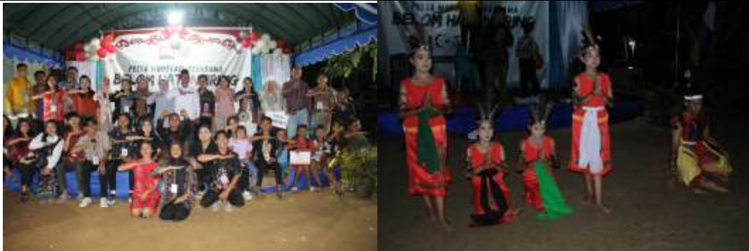
Gambar 1. Pelaksanaan Pesta Moderasi Beragama Belom Hatantiring dan Penampilan Tarian Penyang Hinje Simpei