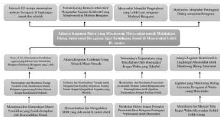
Gambar 5. Pohon Harapan