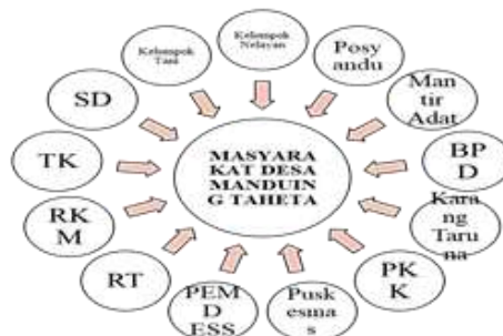
Gambar 3. Diagram Venn