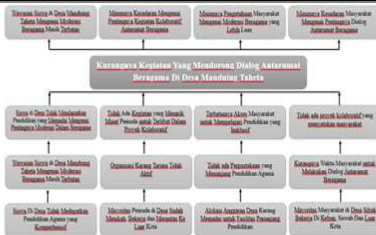
Gambar 4. Pohon Masalah