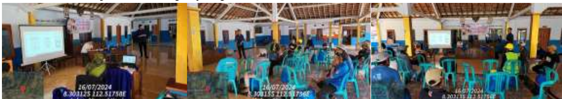
Gambar 2. Penyampaian Materi Kepada Peserta

Hasil penelitian ini mencerminkan kebutuhan unik dari setiap kategori tempat tinggal berdasarkan preferensi serta tantangan yang dihadapi oleh para penghuni, seperti keterbatasan ruang, fungsionalitas, dan estetika yang mereka butuhkan. Temuan tersebut kemudian dijadikan acuan oleh produsen lokal, termasuk tukang kayu dan pekerja bangunan, untuk merancang furniture yang lebih sesuai dengan kebutuhan spesifik konsumen, baik dari segi ukuran, desain, maupun material yang digunakan. (Ratni, dkk., 2020; Pali & Nurdini, 2023). Melalui pendekatan yang berbasis kebutuhan lokal ini, program pengabdian masyarakat berhasil memberikan dampak signifikan, dengan mengarahkan pengembangan desain furniture yang tidak hanya lebih fungsional dan praktis, tetapi juga lebih relevan bagi kehidupan sehari-hari konsumen di kawasan tersebut. Gambar 4 menunjukkan FGD penyampaian materi.