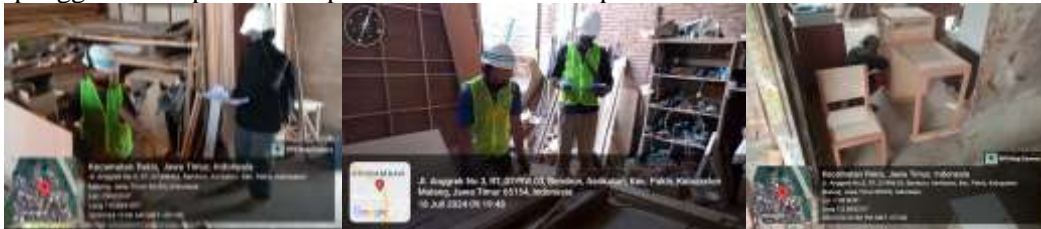
Gambar 3. Proses Pembuatan Produk Smart Furniture