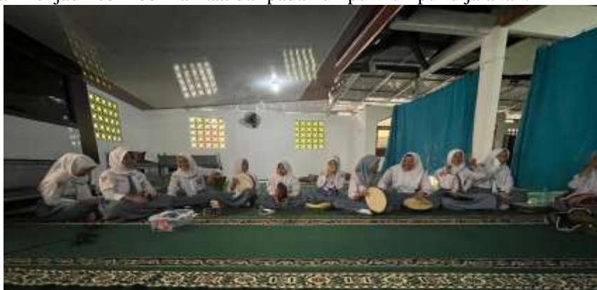
Gambar 1. Pelatihan Maulid Habsyi

PKM ini berlandaskan pada masalah masih belum maksimalnya dalam menguasai Maulid Habsyi sehingga perlu untuk memperlancar dan memperbaiki tabuhan, PKM ini juga menjadikan waktu-waktu yang mereka lewat menjadi lebih bermanfaat daripada kumpul-kumpul dijalanan.