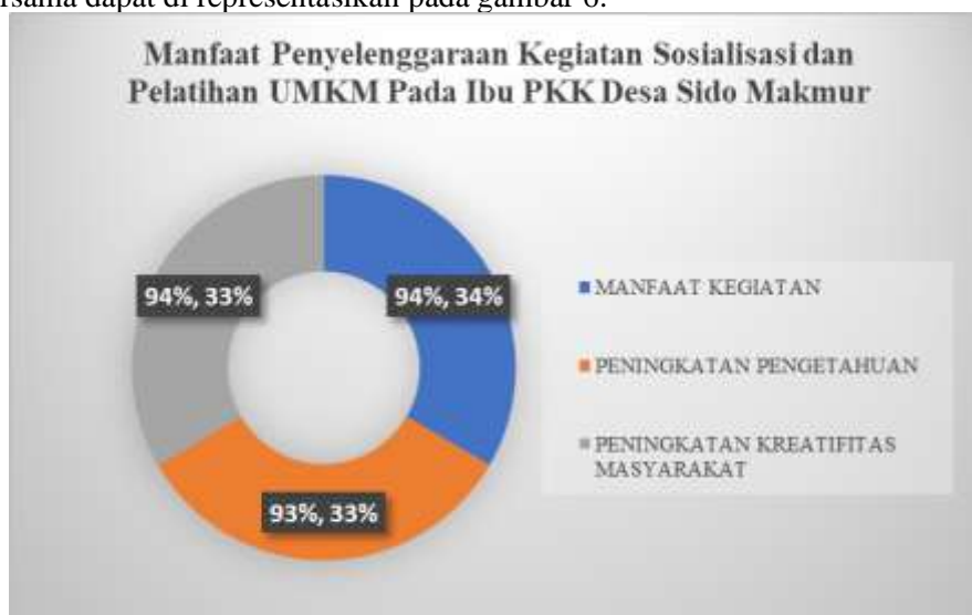
Gambar 6. Dokumentasi kelompok KKN 113 dengan para ibu-ibu PKK Desa Sido Makmur

Kemudian sebagai penutup rangkaian acara sosialisasi dan pelatihan yang dilaksanakan kelompok KKN 113 sebagai panitia pelaksana mengadakan dokumentasi bersama dengan para PKK Desa Sido Makmur. Dokumentasi bersama dapat di representasikan pada gambar 6.