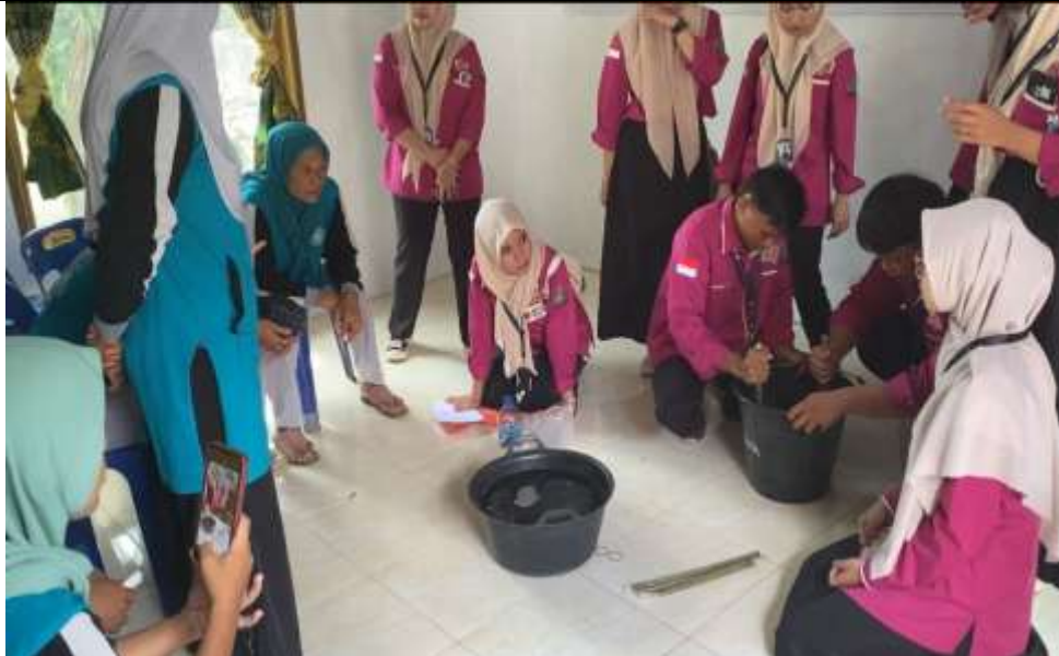
Gambar 5. Proses pembuatan sabun cuci piring

Kemudian sebagai penutup rangkaian acara sosialisasi dan pelatihan yang dilaksanakan kelompok KKN 113 sebagai panitia pelaksana mengadakan dokumentasi bersama dengan para PKK Desa Sido Makmur. Dokumentasi bersama dapat di representasikan pada gambar 6.