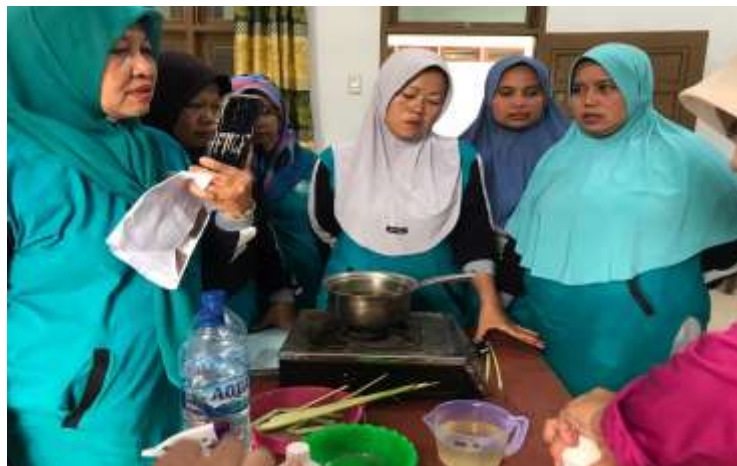
Gambar 4. Dokumentasi kegiatan penyampaian tutorial pembuatan spray anti nyamuk

Agar PKK Desa Sido Makmur dapat menerima informasi sosialisasi dan pelatihan yang diberikan sebagai pedoman dasar dalam meningkatkan UMKM ataupun mengembangkan produk home made , maka seluruh rangkaian penyampaian informasi dalam kegiatan sosialisasi dan pelatihan melibatkan pendampingan para ibu-ibu PKK Desa Sido Makmur. Selanjutnya, kegiatan sosialisasi dan pelatihan menggunakan edukasi berbasis interaktif melalui penggunaan sesi mini-game yang mudah dipahami dengan tujuan memberikan materi sosialisasi dan pelatihan kepada PKK Desa Sido Makmur. Tim pelaksana kegiatan sosialisasi dan pelatihan dan perwakilan peserta mengikuti sesi dokumentasi bersama untuk menutup kegiatan. Gambar 4 dan 5 menunjukkan dokumentasi kegiatan tutorial proses pembuatan spray anti nyamuk dan juga sabun cuci piring dalam kegiatan sosialisasi dan pelatihan dan kegiatan dokumentasi kolaboratif.