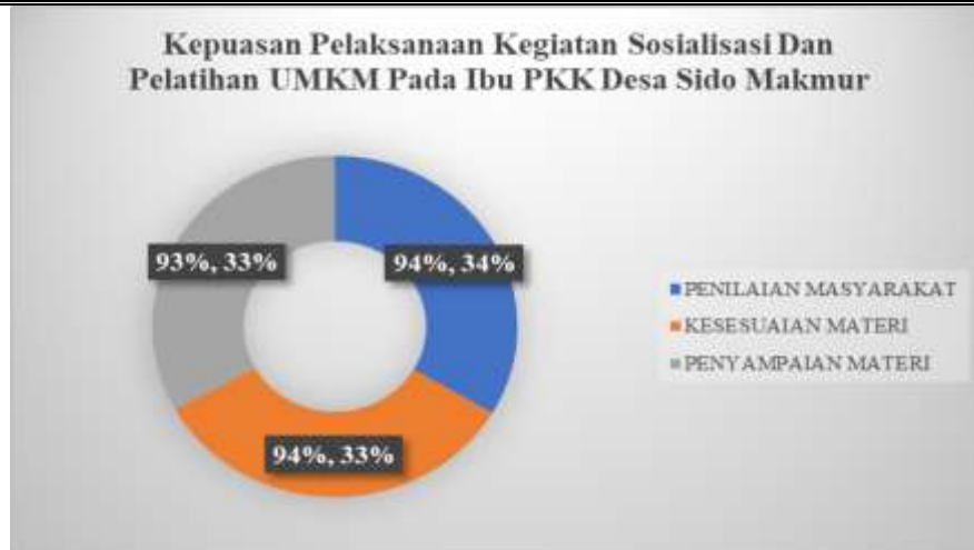
Gambar 7. Hasil Evaluasi Kepuasan Pelaksanaan Kegiatan Sosialisasi Dan Pelatihan UMKM Pada Ibu PKK Desa Sido Makmur

Temuan penilaian yang berkaitan dengan pelaksanaan penyuluhan menunjukkan tingkat kepuasan peserta yang baik. Hal ini terbukti dari skor rata-rata 4 yang diterima peserta pelatihan pada semua alat penilaian yang disediakan. Namun, persentase rata-rata keseluruhan sebesar 94% ditemukan dalam ringkasan Gambar 7 dan 8.