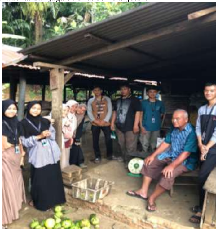
Gambar 1. Sosialisasi Dengan salah satu pemiliki UMKM

Tingginya Tingkat Persaingan, dalam ruang lingkup bisnis rumahan tentunya ada persaingan yang cukup ketat, dalam hal ini tentunya sangat perlu adanya peningkatan pemahaman agar UMKM masyarakat lokal dapat bersaing secara sehat dan juga bersifat berkelanjutan.