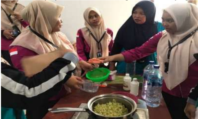
Gambar 3. Dokumentasi kegiatan sosialisasi dan pelatihan pembuatan spray anti nyamuk

Pemberian materi dalam sosialisasi dan pelatihan juga mencakup materi edukasi tentang faktor risiko, proses pemasaran dan sasaran terhadap produk UMKM, selain materi sosialisasi dan pelatihan tentang hal yang telah dijelaskan tadi. Penyampaian materi sosialisasi dan pelatihan berupa sumber terpercaya untuk mendaftarkan produk UMKM tersendiri ke dalam website UKME milik Kementerian Keuangan yang merupakan salah satu cara untuk mendukung hal tersebut. Materi disampaikan dengan metode ceramah, kemudian dibahas dan dijawab pertanyaan-pertanyaan terkait materi sosialisasi dan pelatihan yang diberikan. Gambar 3 menunjukkan dokumen penyaluran informasi tentang materi edukasi yang diberikan.