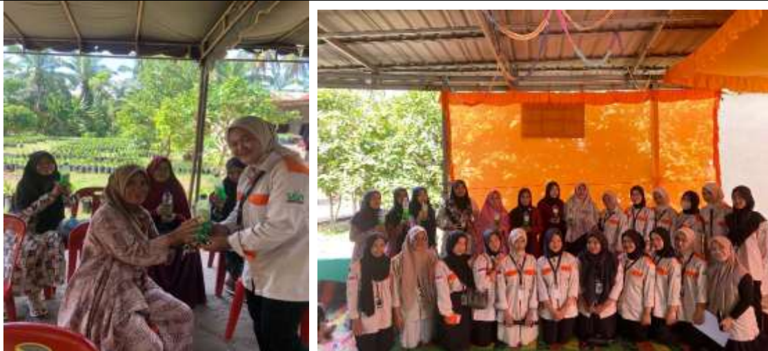
Gambar 1. Kegiatan pembuatan sabun bersama anak KKN