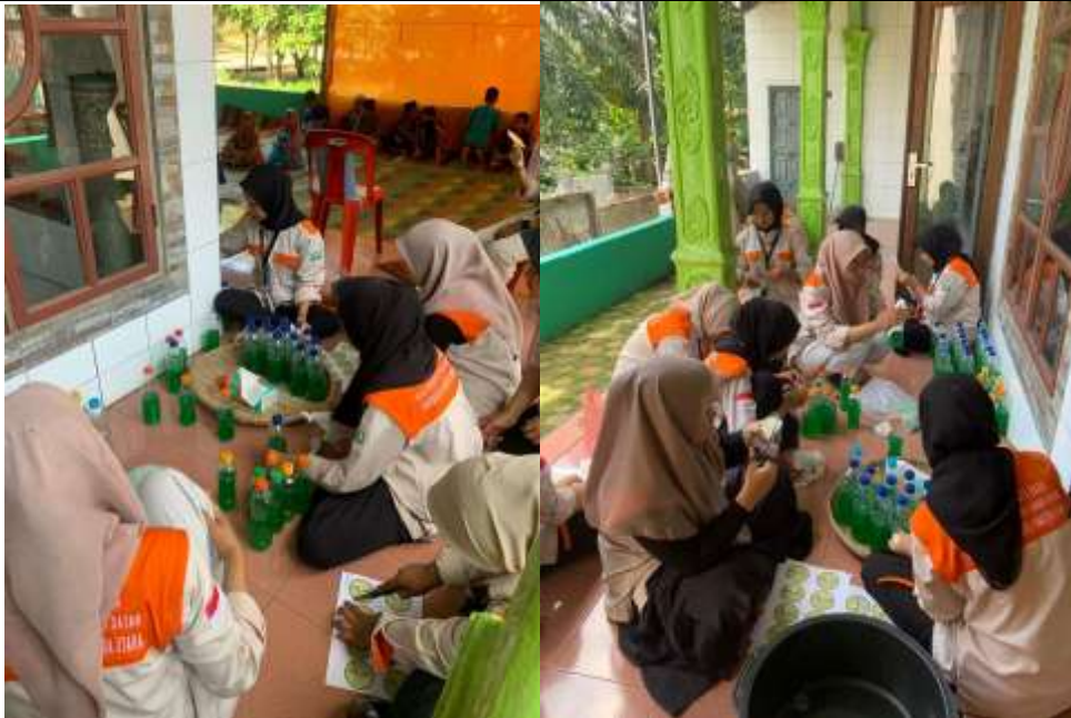
Gambar 2. Kegiatan PkM

Sabun menjadi sesuatu yang sangat penting dalam kehidupan. Salah satunya adalah sabun cuci piring. Sabun cuci piring menjadi kebutuhan primer dalam rumah tangga. Sabun ini berfungsi sebagai bahan penghilang minyak, kotoran, dan lemak pada peralatan makan dan peralatan rumah tangga lainnya. Oleh karena itu, Tim KKN UINSU mengadakan kegiatan sosialisasi dan pelatihan pembuatan sabun cuci piring berbentuk cair kepada ibu-ibu Di Desa Petatal. Kegiatan sosialisasi dan pelatihan ini dilaksanakan pada hari Minggu tanggal 16 agustus 2024 yang bertempat di rumah posko KKN desa Petatal.