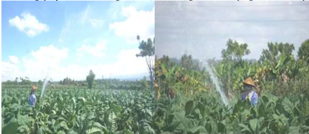
Gambar 1. Penyiraman Tanaman Tembakau Petani Secara Manual