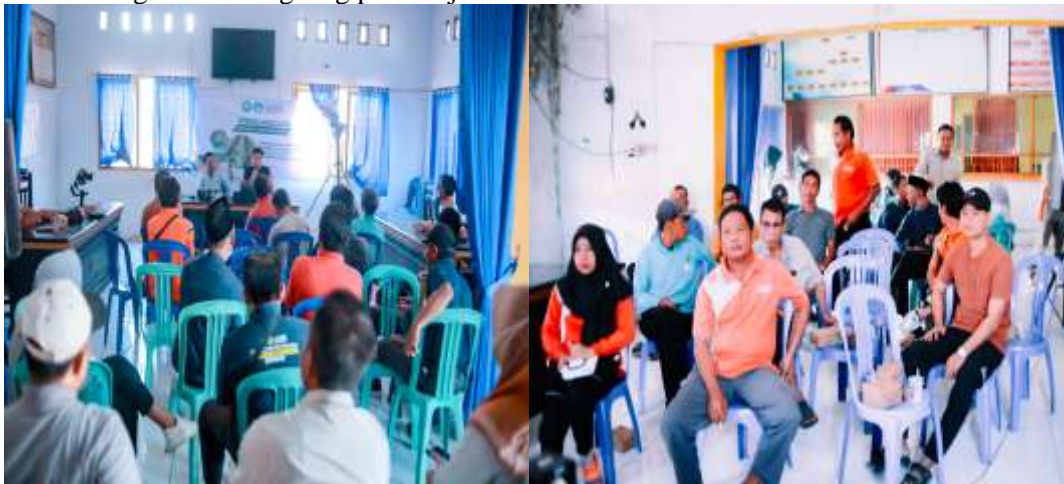
Gambar 4. Pelatihan Perancangan, Pembangunan dan Penggunaan SITETES

Perancangan sistem irigasi tetes diawali penyampaian materi oleh tim pelaksana program. Materi yang disampaikan seputar aplikasi pembangunan SITETES, fungsi dan kegunaan teknologi, cara kerjanya, spek mesin yang digunakan dan optimalisasi penggunaan pada spot lahan usahatani. Jenis mesin yang digunakan pada program kegiatan ini menggunakan Sprinkler Stainless Py 40 ukuran 2inch berfungsi sebagai teknologi primer distribusi pengatur air ke tanaman sehingga lebih efisien dan lebih hemat tenaga kerja, waktu dan biaya produksi. Selanjutnya alat penunjangnya antara lain mesin pompa air Honda GX 200 sebagai tenaga pendorong dan penyedot air ke sprinkler kemudian selang mesin air ukuran 2inch sebagai penghubung. Cara kerjanya antara lain: pasang semua rangkaian mesin pompa air dengan pipa spiral dan selang air; hubungkan selang pompa air ke tiang besi penghubung, pasang mesin sprinkler gun ke tiang besi penyalur air; dan posisikan mesin secara strategis guna tanaman mendapat supply air secara merata. Kegiatan PKM ini dilakukan dengan metode pendekatan Participatory Action Programs dimana anggota kelompok, menerapkan teknologi secara langsung pada objek usahatani.