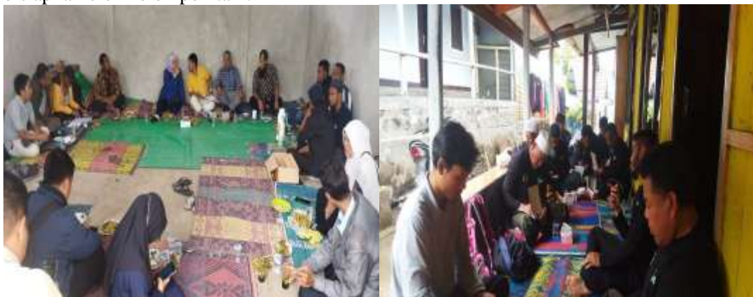
Gambar 3. FGD Bersama Mitra Kelompok Tani Bareng Bersinar 2

Tahap awal pelaksanaan pengabdian kepada masyarakat ini adalah observasi dan FGD bersama mitra sasaran. Tujuannya adalah memberikan penjelasan tentang ruang lingkup kegiatan, hak dan kewajiban anggota kelompok, dan tata kelola pasca program serta koordinasi kegiatan apa saja yang akan dilakukan bersama kelompok. Pada tahap ini ditentukan bersama perihal persiapan tim pelaksana dan bahan alat yang perlu dipersiapkan oleh kelompok tani.