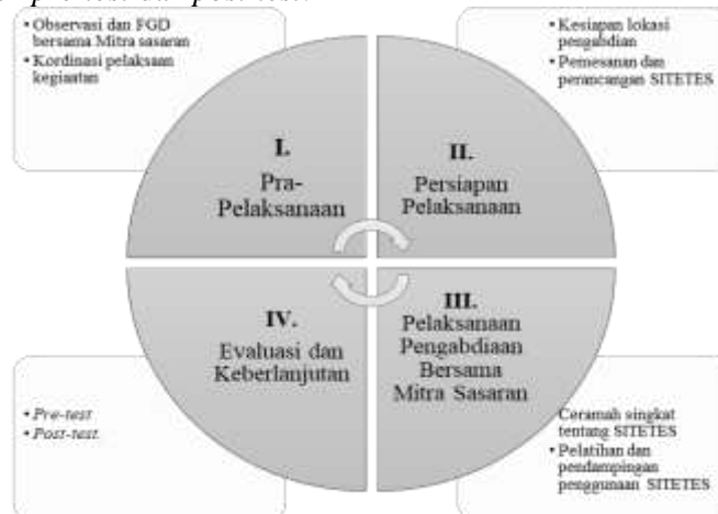
Gambar 2. Tahapan Kegiatan PKM di Kelompok Tani Bareng Bersinar 2

pertanian dalam rangka pengumpulan data untuk merancang dan membangun sistem irigasi tetes. Selanjutnya tahap pelaksanaan kegiatan, perancangan dan pembangunan sistem SITETES. Transfer Technology pada tahapan ini tim pelaksana pengabdian akan merancang dan membangun sistem irigasi tetes sesuai dengan kondisi lahan mitra. Sehingga debit air sesuai dengan kebutuhan lahan dan tanaman menggunakan sprinkler gun . Knowledge Transfer : Tahapan selanjutnya, akan dilakukan sosialisasi dan pelatihan kepada anggota kelompok tani mengenai cara penggunaan SITETES dalam melakukan penyiraman tanaman usahatani tembakau. Evaluasi Kegiatan : dimana pada tahapan ini dilakukan berdasarkan peningkatan pengetahuan dan skill anggota kelompok tani dalam memanfaatkan SITETES yang diukur menggunakan instrumen pre-test dan post-test .