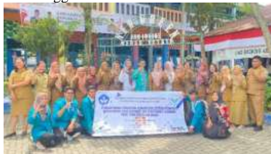
Gambar 5. Foto Pelaksanaan PKM

Hasil evaluasi dilakukan untuk mengetahui keberhasilan pembelajaran berbasis literasi dan numerasi dalam pembelajaran Bahasa Inggris berdasarkan Kurikulum Merdeka yang diterapkan. Selain itu, tim melakukan kunjungan untuk tahapan evaluasi ini untuk terus mengontrol apakah perangkat pembelajaran ini dapat berjalan dan agar terus berjalan dengan baik. Adapun hasil program pengabdian diuraikan sebagai berikut: 1. Pengetahuan dan minat dari para peserta pelatihan tentang konsep dasar pembelajaran Bahasa Inggris berbasis literasi dan numerasi terus meningkat yang ditunjukkan oleh interaktif peserta dalam mengikuti pelatihan ini. 2. Tingkat pengetahuan dan penguasaan dalam perancangan dan mendesain pembelajaran Bahasa Inggris berbasis literasi dan numerasi terus meningkat yang ditunjukkan dengan sudah sesuai dengan kebutuhan pembelajaran di sekolah dasar. 3. Pembelajaran berbasis literasi dan numerasi pada mata pelajaran Bahasa Inggris tingkat sekolah dasar terhadap hasil pembelajaran peserta didik berhasil diterapkan terbukti dengan masih digunakan hingga saat ini.