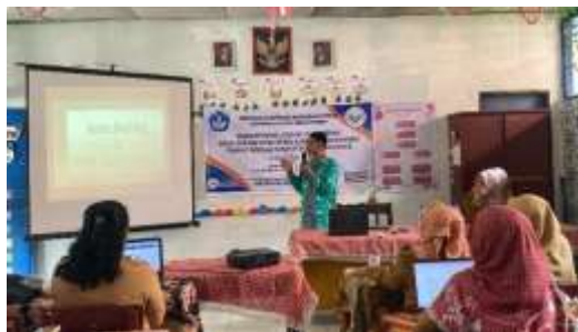
Gambar 2. Pemaparan Konsep Pembelajaran berbasis Literasi dan Numerasi

Pada sesi ini, peserta pelatihan diberikan materi tentang konsep pembelajaran Bahasa Inggris tingkat sekolah dasar berbasis literasi dan numerasi. Sebelum menyampaikan materi, terlebih dahulu disampaikan atau memperkenalkan tujuan dari pengabdian kepada masyarakat ini. Kemudian memperkenalkan secara teori tentang pengetahuan literasi dan numerasi tingkat sekolah dasar pada para guru.