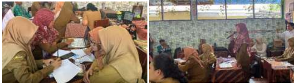
Gambar 3. Praktek Perancangan Pembelajaran berbasis Literasi dan Numerasi

Gambaran Ipteks yang akan dilaksanakan kepada mitra dalam pelatihan dan pendampingan ini adalah para guru mampu membuat dan mendesain pembelajaran Bahasa Inggris berbasis literasi dan numerasi yang lebih sesuai dengan kebutuhan siswa/siswi di sekolah dasar. Sehingga mereka dapat melakukan evaluasi hasil belajar menulis teks prosedur siswa/siswi sesuai dengan kebutuhannya. Secara keseluruhan gambaran Ipteks tersebut dapat dilihat pada gambar desain pembelajaran Bahasa Inggris berbasis literasi dan numerasi di sekolah dasar.